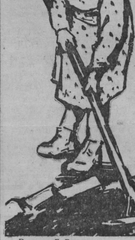
Рисунки Г. Захарова.

Только в Бачатской школе Беловского района 10 тысяч кур и 1 775 уток, в Арлюнской школе Юргинского района — 16 тысяч кур, в Кемеровском районе школьники сдали государству 12 тысяч кур.