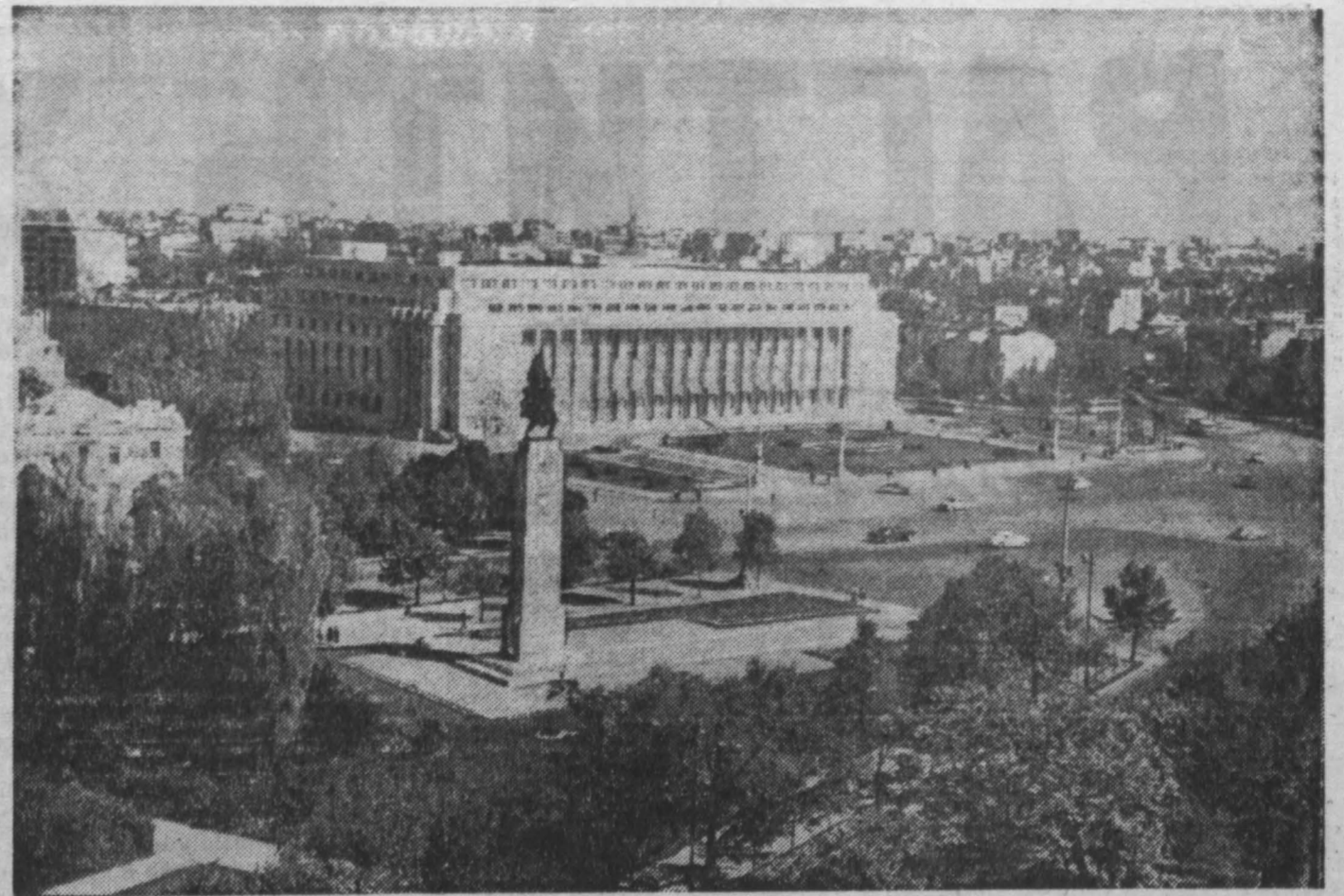
Румынская Народная Республика. Бухарест, Совет Министров РНР.

ПАРИЖ, 11 июня. (ТАСС). Города и населенные пункты Алжира окутаны дымом пожаров. Горят школы, библиотеки, учреждения, промышленные предприятия. Парижская буржуазная газета «Фигаро» сообщает сегодня, что за последние двое суток только в городе Алжир бандами из ОАС было совершено пятьдесят взрывов и поджогов. Полностью разрушено двадцать пять общественных и частных зданий, десять