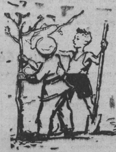
Выработать у школьников определенные навыки и умение работы на полях, привить им любовь к сельскому хозяйству мы можем при условии серьезной опытнической работы, проводимой в школе, начиная с первого класса.