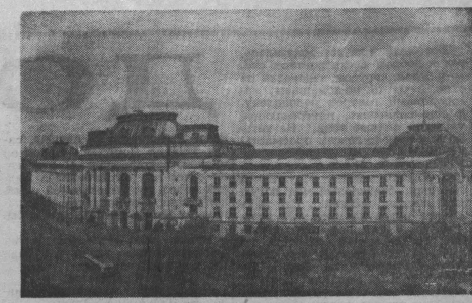
Софийский государственный университет.

Народное творчество нашло свое яркое выражение в чудесных мелодиях народных песен, в национальных хорах и плясках, которые мне удалось увидеть не только на сценах театров, но и на площади во время демонстрации трудящихся, посвященной празднованию 7 ноября 1961 года. Из народных талантов выросли известные артисты. Театральные сцены Советского Союза, США, Италии, Франции и многих других стран не раз принимали талантливых болгарских оперных певцов —