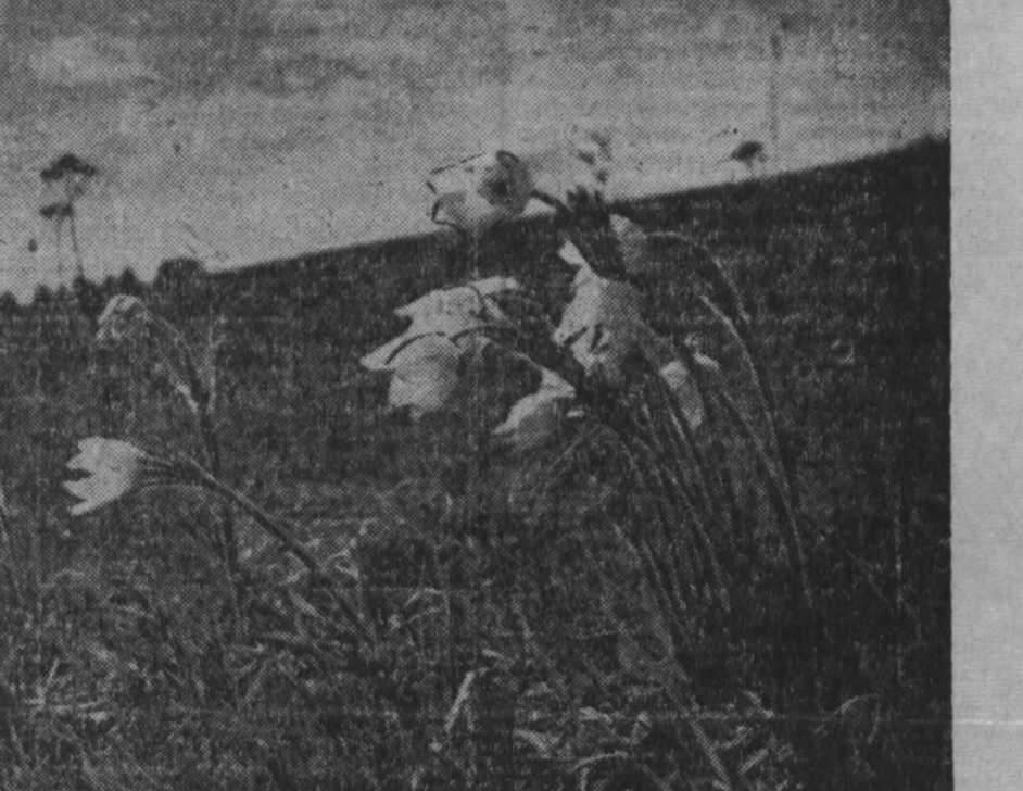
Полевые цветы. Зам. редактора П. Л. ГУЛЫЙ.

К чести футболистов СССР надо сказать, что они выдержали небывалый по силе и темпу натиск сумели переломить игру. Во время одной из атак Численко ударил по мячу с такой силой, что тот, прорвав боковую сетку, влетел в ворота. Судья не заметил этого казуса и засчитал гол. На трибунах поднялся невероятный шум, команда Уругвая округлила судью, доказывая несправедливость его решения. Но боковой судья Душ (ФРГ) подтвердил взятие ворот. Тогда на поле выбежали руководители уругвайской команды. После митинга, который продолжался несколько минут, Ионин отменил свое решение. Вообще говоря, его судейство было неуверенным, с большим количеством ошибок. И вот наступила последняя минута состязания. Численко хорошо прошел по краю, передал мяч Хусаинову в центр штрафной, тот — Понедельнику, который сильно пробил низом. Соса в броске отбил мяч, но набежавший Иванов снова послал его в ворота. 2:1. Этот гол принес сборной СССР победу.