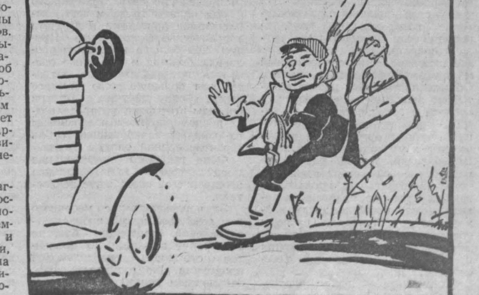
В защиту... сорняков.

За отчетные сутки кукурузы в целом по области посеяно больше, чем за предыдущие, на 2,603 га. Есть, конечно, прирост. Но как же он недостаточен для того, чтобы можно было рассчитывать на завершение сева в лучшие сроки! Не по 9,000 — 10,000 гектаров надо сейчас засеивать этой культурой в день, а по 20 — 25 тысяч гектаров. Только такая работа позволит в лучшие сроки посеять «королеву полей».