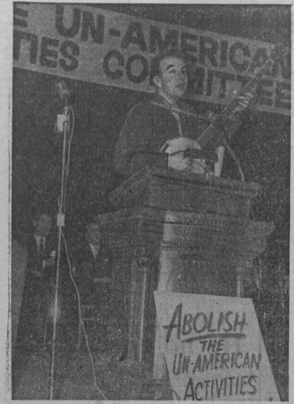
В Нью-Йорке, в зале «Манхэттен центр», состоялся массовый митинг, организованный Нью-Йоркским комитетом за ликвидацию комиссии конгресса по расследованию антиамериканской деятельности. Гасиши студентов, рабочих, служащих пришел для того, чтобы выразить свой решительный протест против наступления реакции на остии демократических свобод в США.

УПРАВЛЕНИЮ МЕХАНИЗАЦИИ треста «Кемеровстрой» компрессорщики, автокрановщики, автолесари, слесари по ремонту дизельных моторов, топливной аппаратуры; кузнецы, медники, разнорабочие (мужчины).