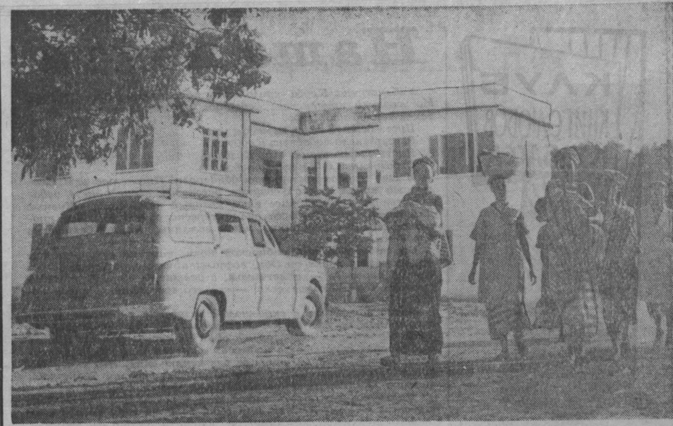
ГВИНЕЙСКАЯ РЕСПУБЛИКА КАНКАН. Около родильного дома.