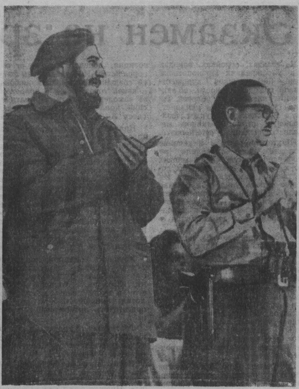
Президент Кубинской Республики Освальдо Дортикос и премьер-министр Фидель Кастро на пароде 2 января 1961 года в честь празднования 2-й годовщины кубинской революции.