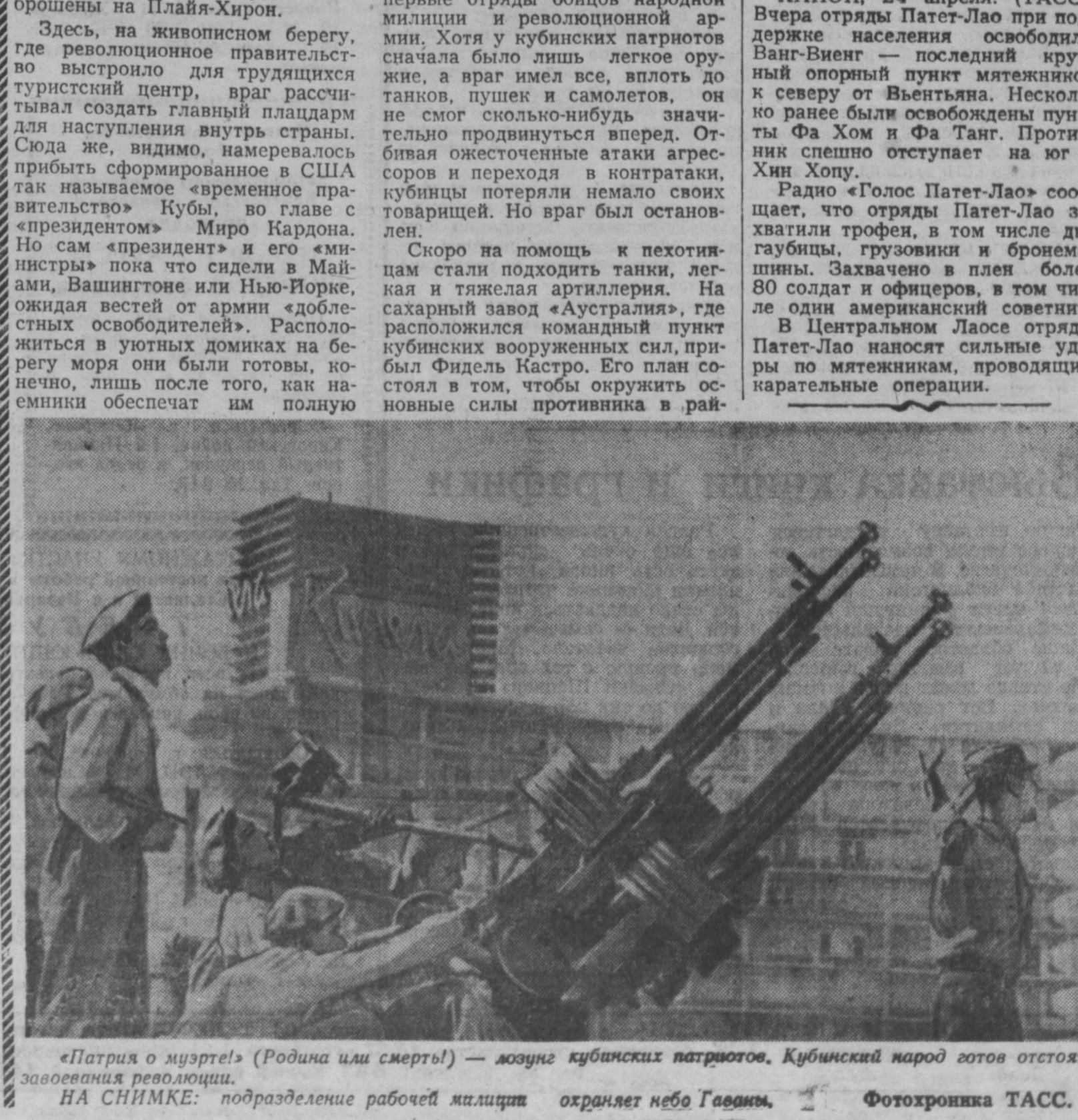
«Патрия или смерть!» (Родина или смерть!) — юные кубинские патриоты, Кубинский народ готов отстаивать завоевания революции. НА СНИМКЕ: подразделение рабочих милиции охраняет небо Гавайи.