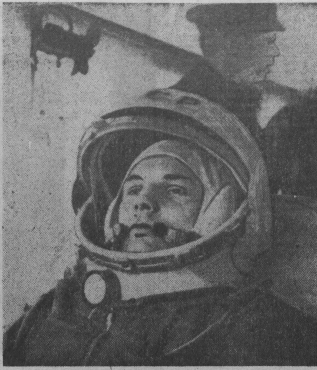
Первый в истории космонавт Ю. А. Гагарин едет по космодрому к космическому кораблю. Гагарин в облачении космонавта перед тем, как он поднимается к кабине космического корабля. Гигантский космический корабль из огненного облака взмывает к звездам.