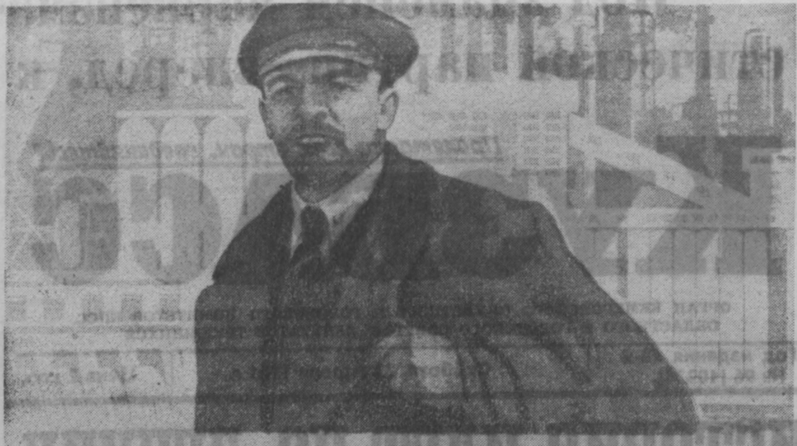
МЫ ПРИДЕМ К ПОБЕДЕ КОММУНИСТИЧЕСКОГО ТРУДА

Горняки шахты коммунистического труда встречают день рождения великого вождя и учителя В. И. Ленина новыми трудовыми победами. Двухнедельный план значительно перевыполнен.