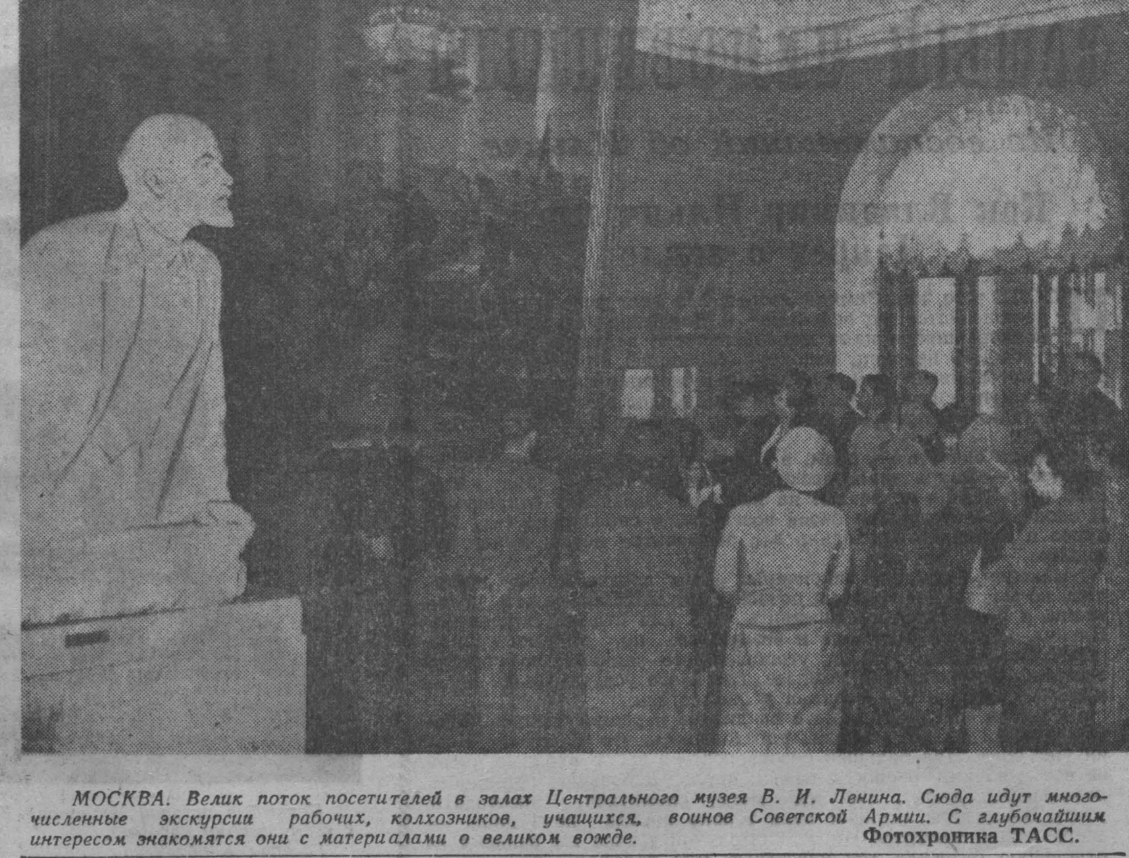
МОСКВА. Велик поток посетителей в залах Центрального музея В. И. Ленина. Сюда идут многочисленные экскурсии рабочих, колхозников, учащихся, военных Советской Армии. С любящим интересом знакомятся они с материалами о великом вожде.