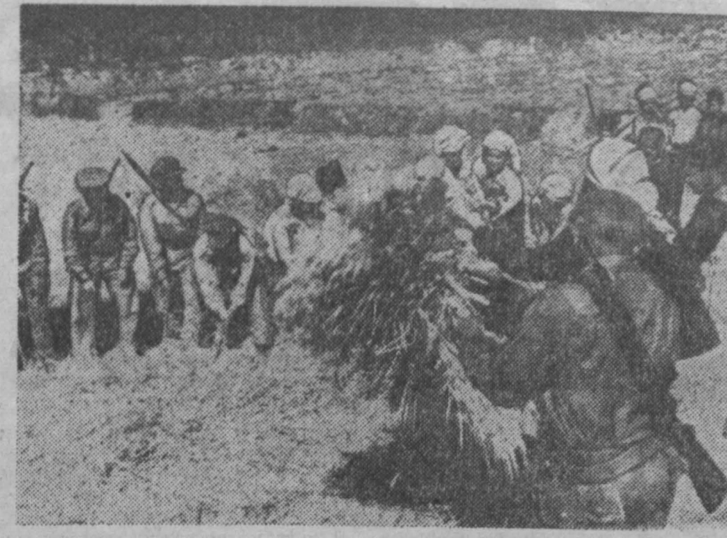
Бойцы отрядов Патет-Лао помогают местному населению молотить рис.

ПАРИЖ, (ТАСС). Ультраколониалисты, стремящиеся не допустить переговоров с представителями временного правительства Алжирской Республики, заметно активизировали свою деятельность. Лидеры различных колониалистских организаций и движений открыто выступают против переговоров с представителями алжирского народа и за продолжение войны в Алжире. В частности, безымянный Жорж Биндери и один из активнейших участников фашистского митинга в Алжире 13 мая 1968 года полковник Томазо развешают по стране и делают провокационные антиправительственные заявления на собраниях сторонников «французского Алжира».