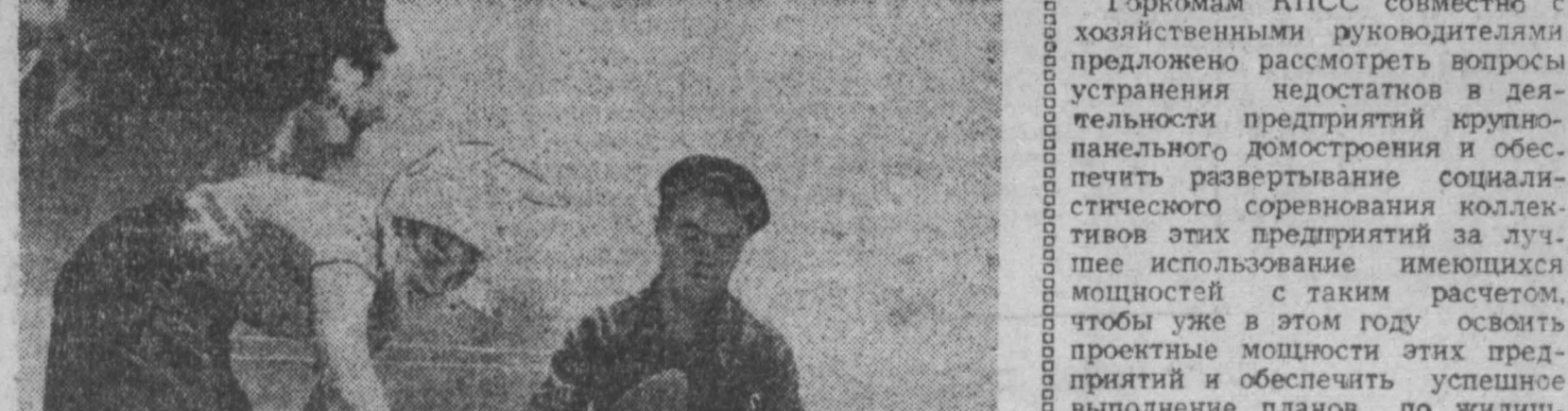
В Москве открылась Всесоюзная фотоэкспозиция «Семилетка в действии». Публикуем два снимка этой выставки. «На строительстве Ново-Воронежской атомной электростанции» и «На производственной практике».