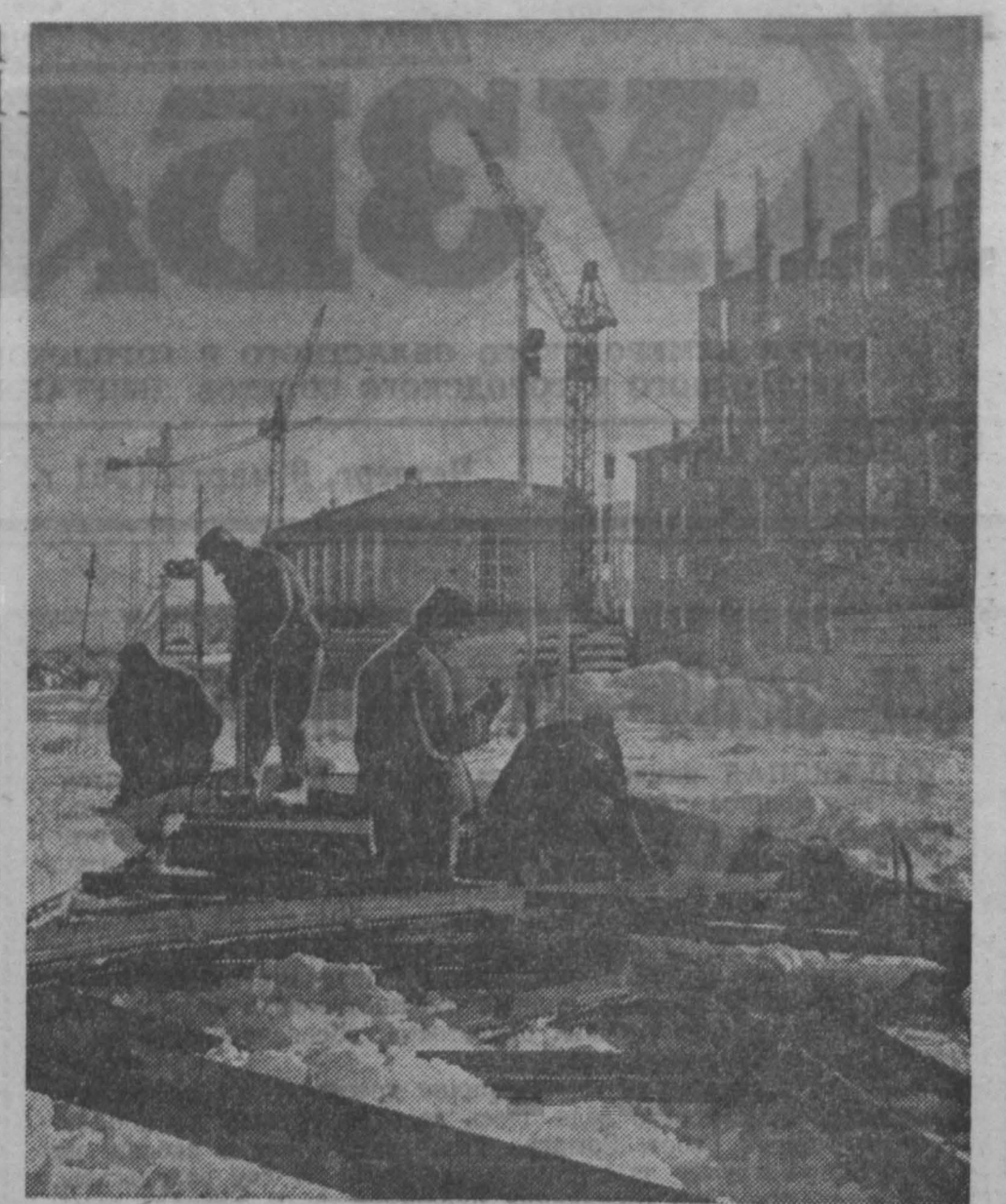
Быстрыми темпами идет строительство педа пролактама на Кемеровском химкомбинате.

Известный научный микробиолог, получивший препарат он назвал «коробактерином». При обработке препаратом вареного картофеля содержание белка в нем повышается в двенадцать раз. Обогатятся и другие малоценные, бедные белками корма. Помимо белка, говорит тов. Орбинский, после обработки в кормах накапливаются молочная кислота, ценный витамин В-12, являющийся сильнейшим стимулятором роста молодого животного, особенно поросят и птиц. Поросята, получившие ежедневно 700—800 граммов картофеля с микробом, давали привес на 70—90 процентов выше, чем поросята содержавшиеся на обычных кормах. Впервые выступает на таком большом совещании ученица десятого класса Калачинской средней школы Омской области Лена Хрущева. Но ей есть что сказать о своем первом уроке. Выросла она летом вместе с подругами по занятию, государству сдаю 632 центнера утиного мяса! Юная птичница так рассказывает о том, как полюбились школьникам занятия трудом. Все ученики нашей школы, говорит Лена Хрущева, также учаются полезному труду. В прошлом году они вырастили 105 тысяч уток и кур. А в этом году только на истребление вырастить 50 тысяч водоплавающих птиц.