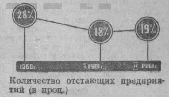
Количество отстающих предприятий (в проц.)

За два месяца шахтеры Кузбасса добыли дополнительно к плану 152 тысячи тонн угля, в том числе около 100 тысяч тонн коксующегося. Большинство шахт и трестов в феврале работало лучше, чем в январе. Особенно радуют успехи горняков Кемеровского рудника, на котором нет отстающих предприятий. Широкое распространение по-