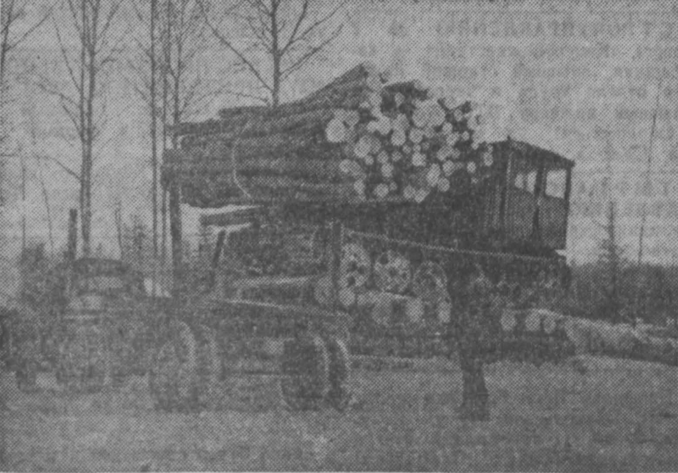
Погрузка — наиболее трудоёмкая операция в технологии вывозки леса. Еще совсем недавно она была одним из «узких мест» в леспромхозе. Построили специальные эстакады, лесозаготовители намного ускорили вывозку древесины.

На снимках (сверху вниз): сортировщики увязывают пачку леса тросом; трактор везет на эстакаду; погрузка пачки на лесовоз.