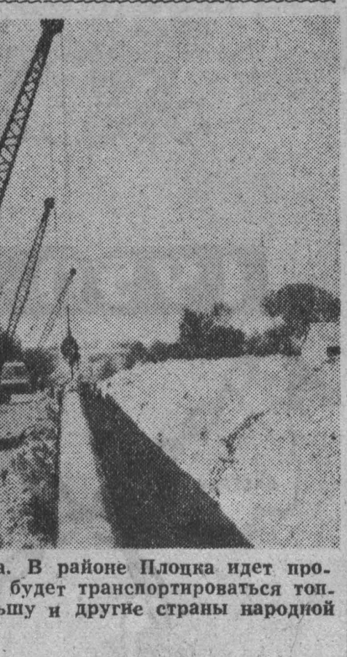
Польская Народная Республика. В районе Плоцка идет прокладка нефтепровода, по которому будет транспортироваться топливо из Советского Союза в Польшу и другие страны народной демократии.