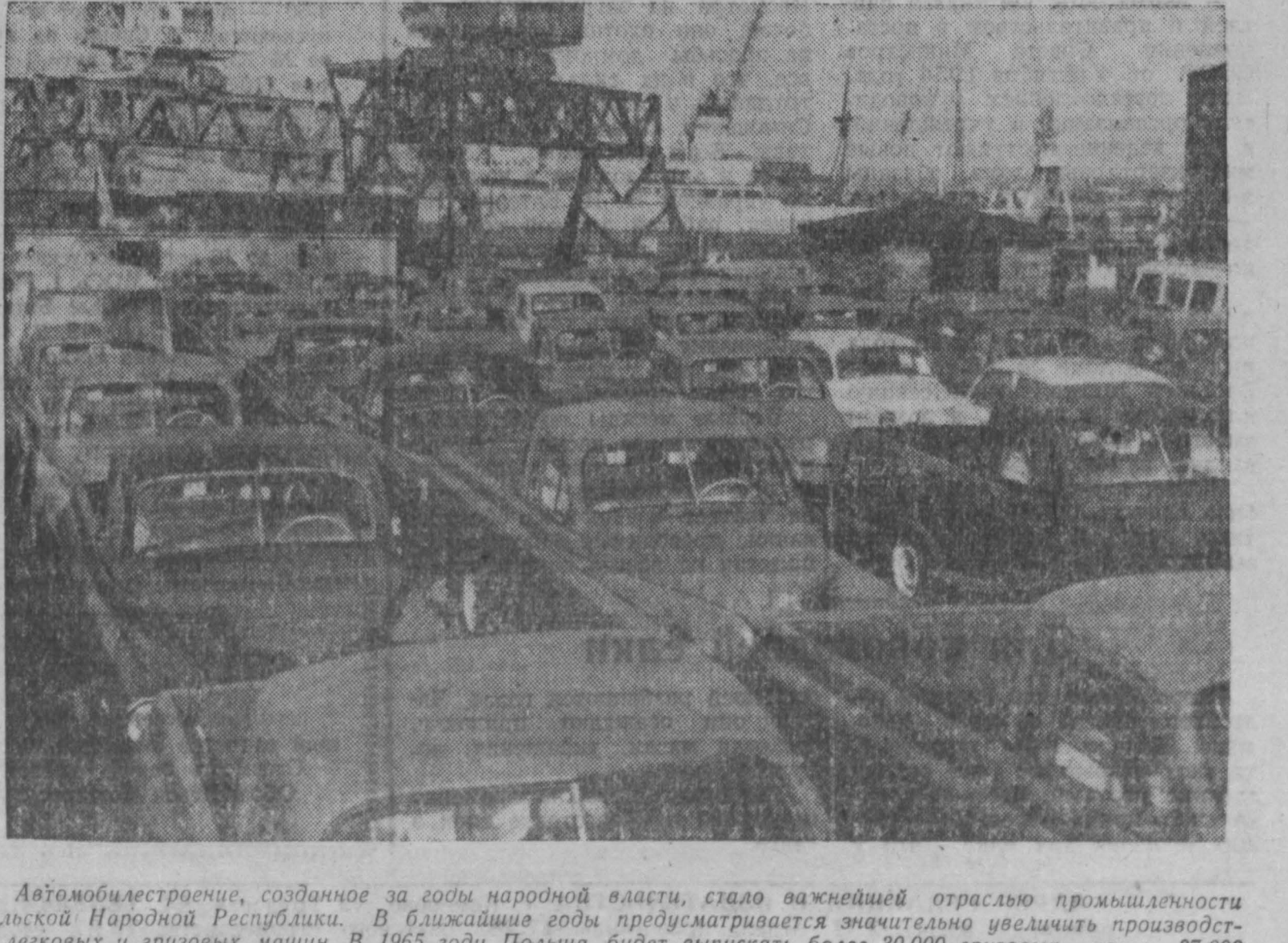
Автомоблестроение, созданное за годы народной власти, стало важнейшей отраслью промышленности Польской Народной Республики. В ближайшие годы предусматривается значительно увеличить производство легковых и грузовых машин. В 1965 году Польша будет выпускать более 30 000 грузовых, почти 37 000 легковых автомобилей и более 3,5 тысячи автобусов. Много грузовых и легковых машин экспортируется в другие страны. НА СНИМКЕ: в Гдыньском порту. Автомобили, предназначенные для отправки на Кубу.