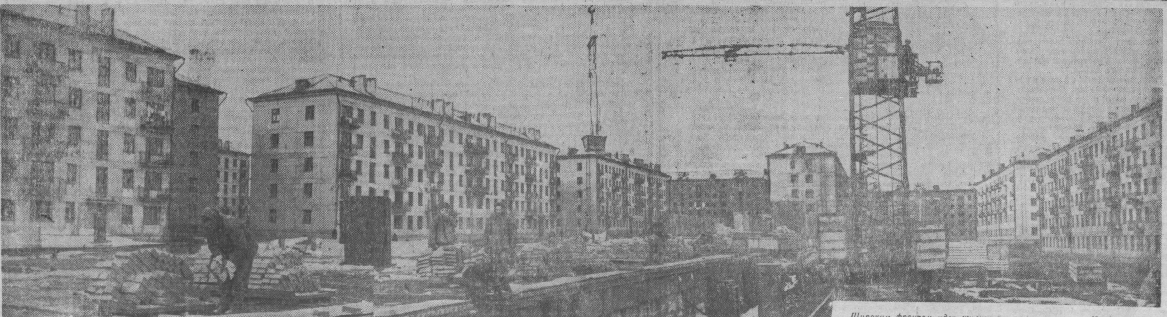
Широким фронтом идет жилищное строительство в Новокузнецке.

вовавшими на совещании с большой речью выступил товарищ Н. С. Хрущев. Его речь выслушавшая с огромным вниманием, неоднократно прерывалась аплодисментами. Совещание приняло обращение ко всем рабочим и работникам совхозов, колхозникам и колхозницам, специалистам и всем трудящимся сельского хозяйства Целиноградского края. С большим подъемом принято приветственное письмо Центральному Комитету КПСС.