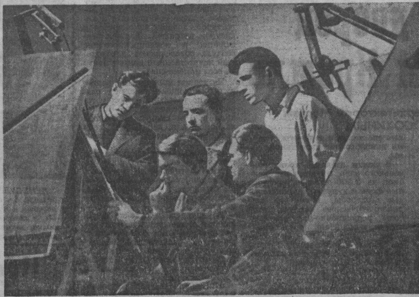
Конструкторы филиала Всесоюзного института пластических масс — активные помощники коллектива керемовского завода «Карболит» в борьбе за рост выпуска продукции.

Сейчас они работают над разработкой новой заводской роторной линии.