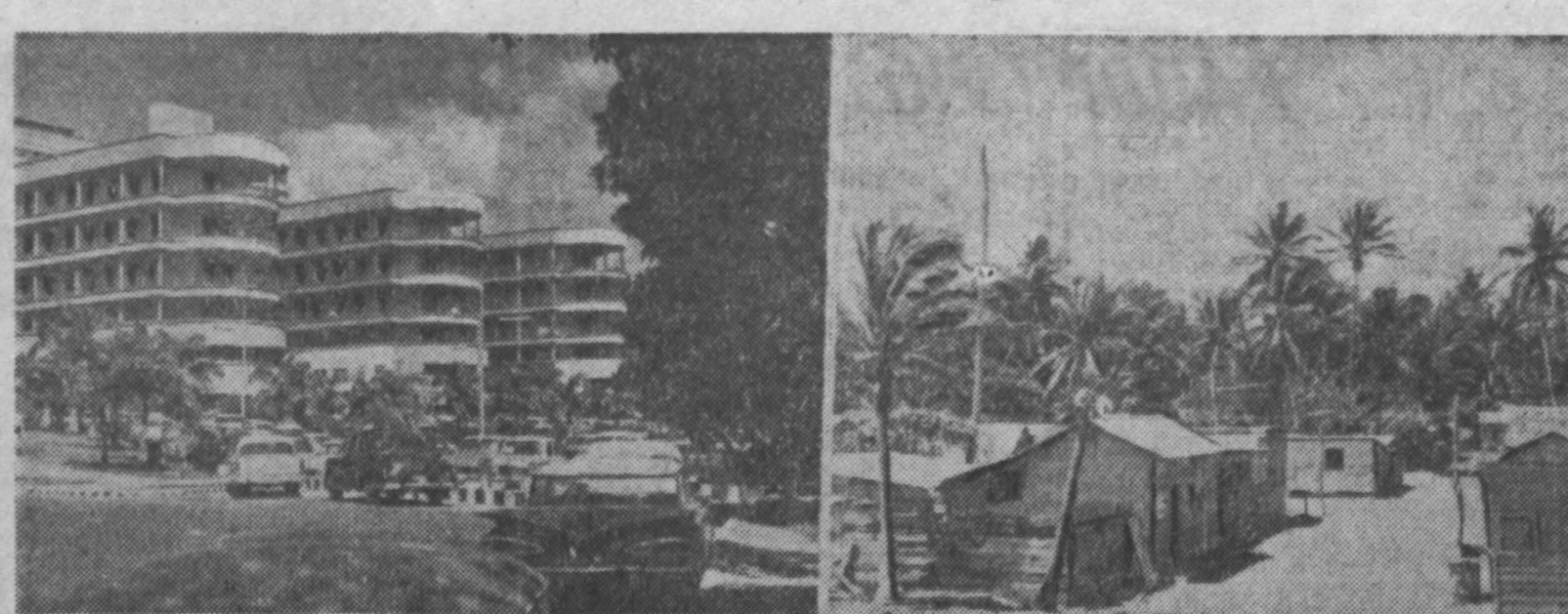
ВЕНЕСУЭЛА — страна контрастов. Здесь в предельной близости уживаются богатство и бедность, роскошь и нищета. В центре Каракаса — небоскребы, в которых размещаются нефтяные компании и банки, многоэтажные жилые дома со всеми удобствами. На окраинах и за чертой столицы — жалкие лачуги, в которых ютятся бедняки. Многие из них работают на нефтепромыслах, другие добывают хлеб тяжелым трудом на полях.

ров широко применены отогнательные кофевекторы, аневризм, в которых удачно сочетается с архитектурой, хорошо вписывается в рисунок витражей. Мощная вентиляция и кондиционирование воздуха обеспечивают необходимый искусственный климат почти во всех помещениях. Из здания можно вести радио- и телевизионные передачи, связаться по телефону с любым городом Советского Союза. Работники прессы смогут, не выходя из помещения, передавать свои сообщения во все уголки земного шара. Строители позаботились и о том, чтобы создать в здании хороший вертикальный транспорт. Кроме лифтов, здесь оборудованы бесшумные эскалаторы, которые доставляют людей с этажа на этаж. Во внутренней отделке в убранстве самое широкое применение нашли мрамор всевозможных расцветок, золотистый боливийский туф, пластик, легкие сплавы и другие материалы. Удобная и красивая мебель сделана по особым эскизам. 47 союзных стран приняла участие в сооружении Большого Кремлевского театра, поставляет строительные материалы, осветительную аппаратуру, мебель, оборудование. Его возводили многочисленные коллективы проектировщиков и строителей. Здание воздвигнуто за рекордный срок — менее чем за полтора года. Свой вдохновенный труд строители посвятили XXII съезду Коммунистической партии Советского Союза.