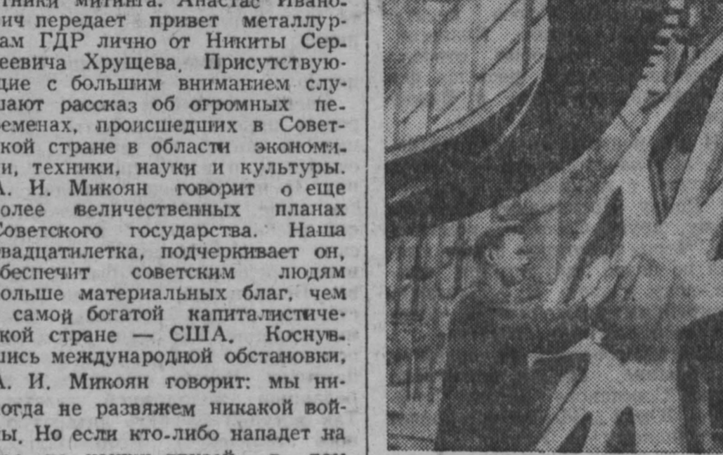
Члены советской делегации и сталевары завода Фрейтала.