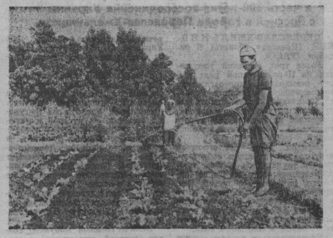
Молодая Гвинеяская Республика заботится о развитии своей национальной экономики...

Застала зима в летней одежде. В. БЕЛЕНКИН. вештатный корреспондент «Кубасса».