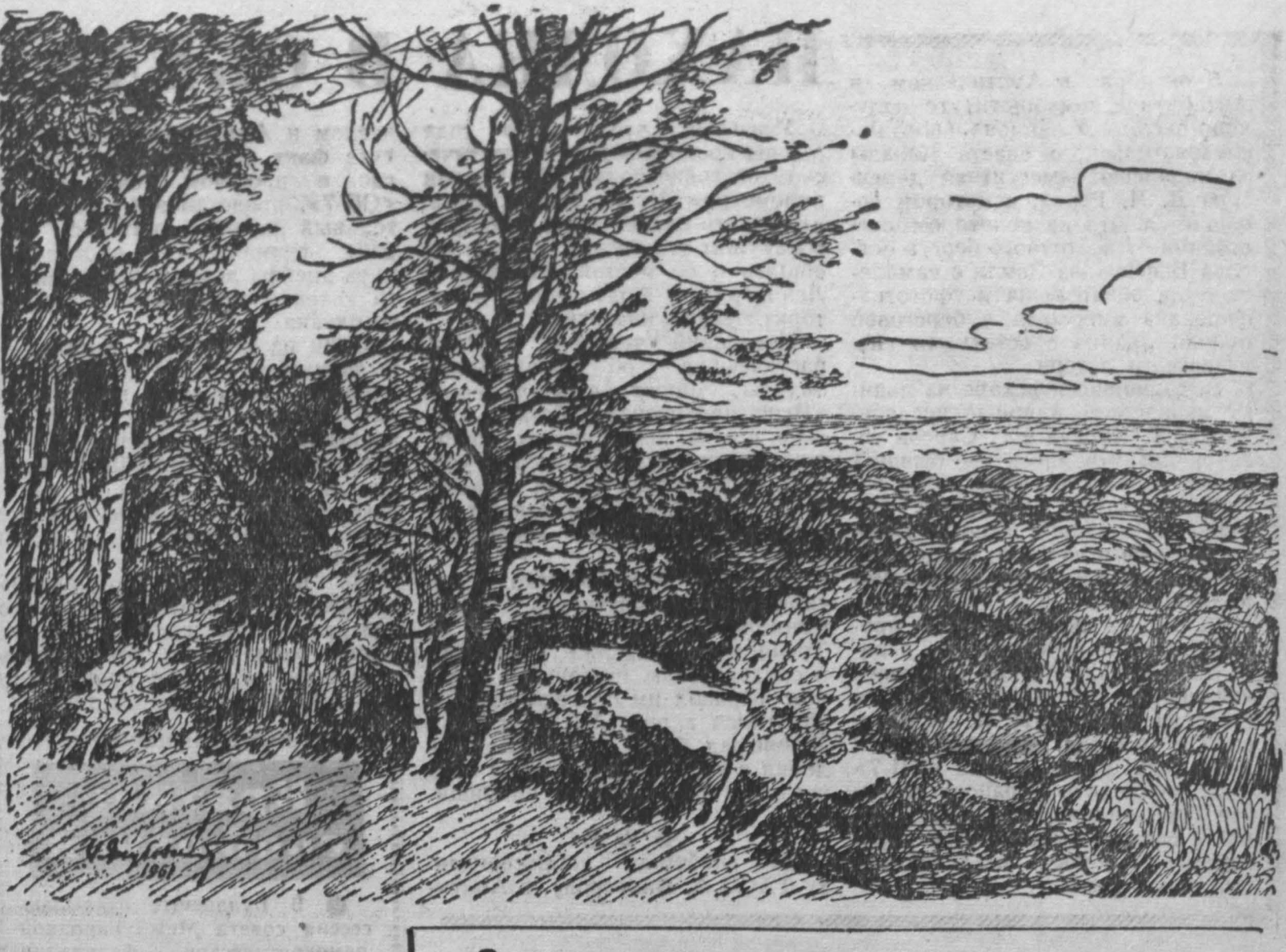
Хороши окрестности реки Инь осенью.

Адрес редакции и издательства: г. Кемерово, ул. Трудовая, 64. ТЕЛЕФОНЫ: редактора 2-24, заместителей редактора 8-05 и 2-37, ответственного секретаря 2-53, секретариата 4-85, отделов редакции и административной работы 17-28, отдела пропаганды 15-67, уполномоченного 4-57, отдела культуры и быта 15-36, информации 14-21, отдела шрифтов 11-52, отдела объявлений 6-83, ночной приемной информации 14-21, технического секретаря 2-я города, 2-78, бухгалтерии 6-83, директора типографии 3-96.