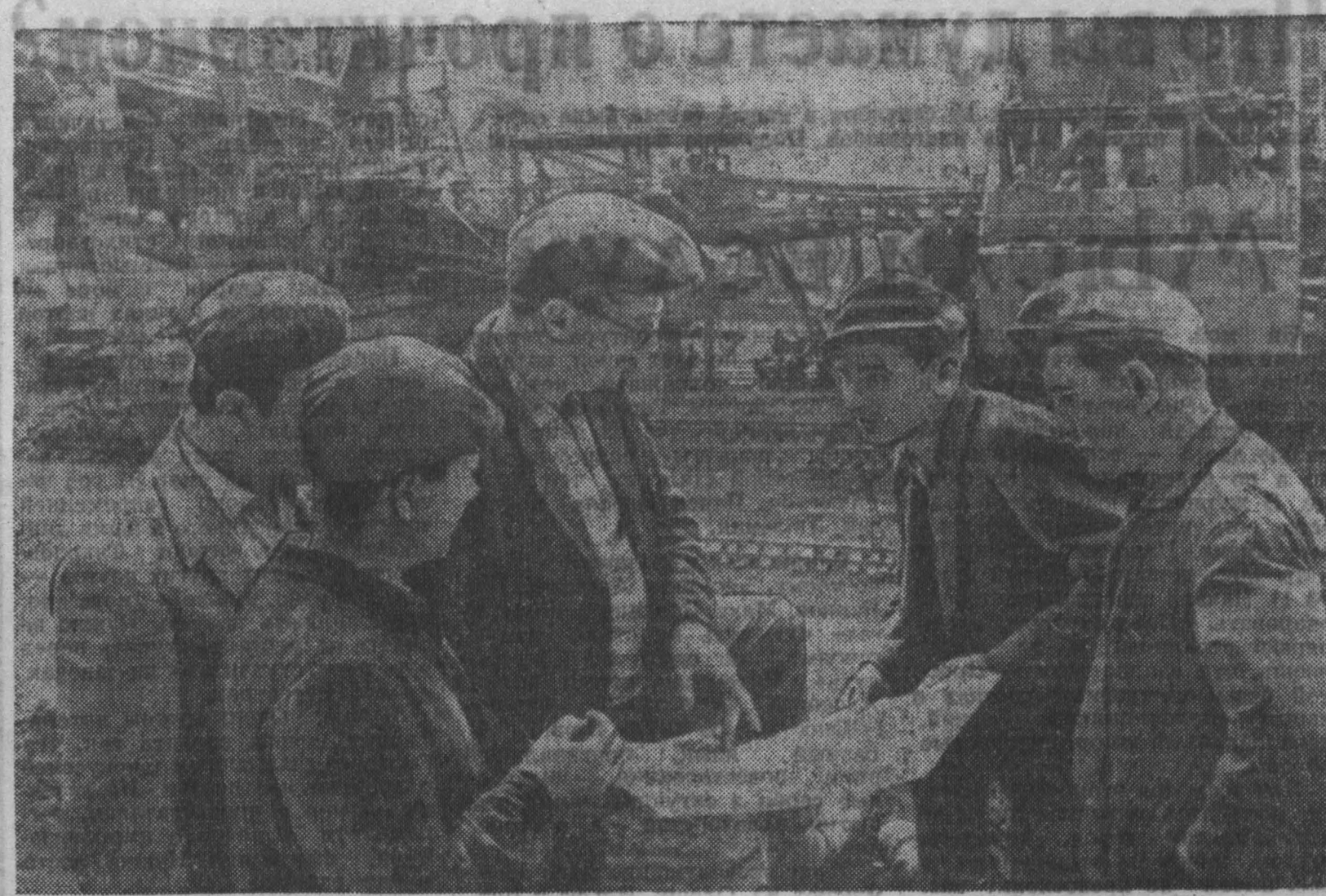
Германская Демократическая Республика Горняки бурого угля комбината в Зеленхейде решили добыть в этом году 600 тысяч тонн угля сверх плана. НА СНИМКЕ: горняки-механизаторы обсуждают сменное задание.