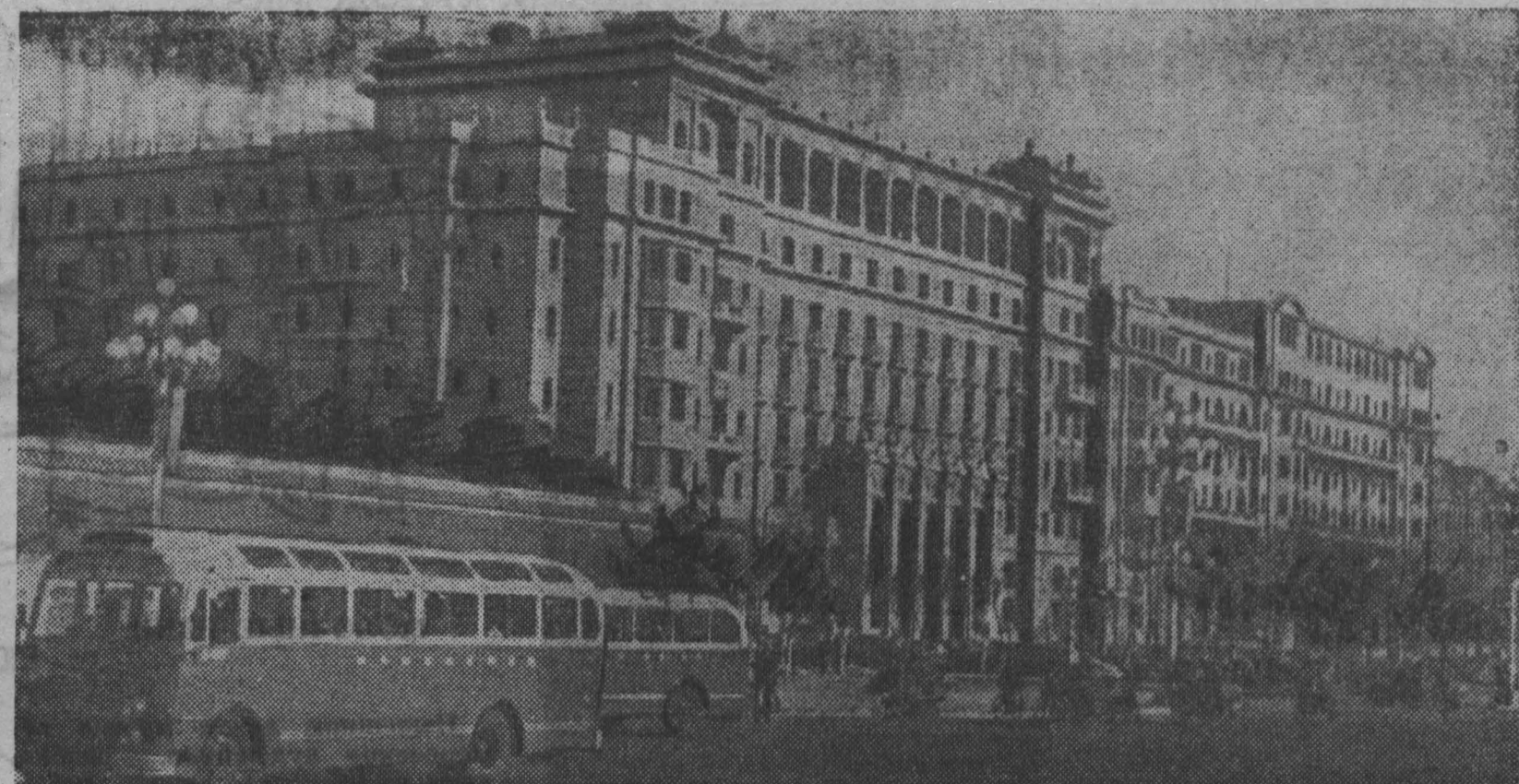
Быстрыми темпами в народном Китае развивается промышленное, жилищное и культурно-бытовое строительство. НА СНИМКЕ: новая гостиница в Пекине.

Ю. ТОТЫШ. Управление № 6 треста «Кузнечжилстрой».