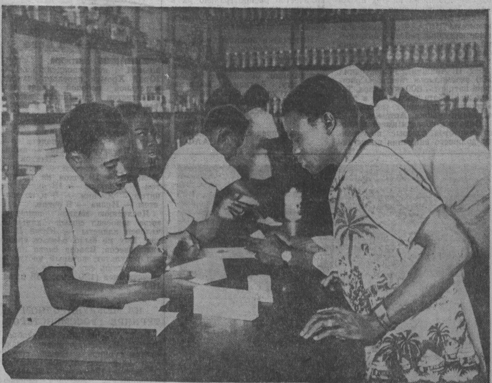
МАЛИ. Народная аптека в Бамако — первый государственный магазин, открытый в стране после предоставления независимости. Большая часть медикаментов и лекарств, продаваемых здесь, получена из социалистических стран. Цена этих лекарств в два раза ниже, чем закупленных во Франции.