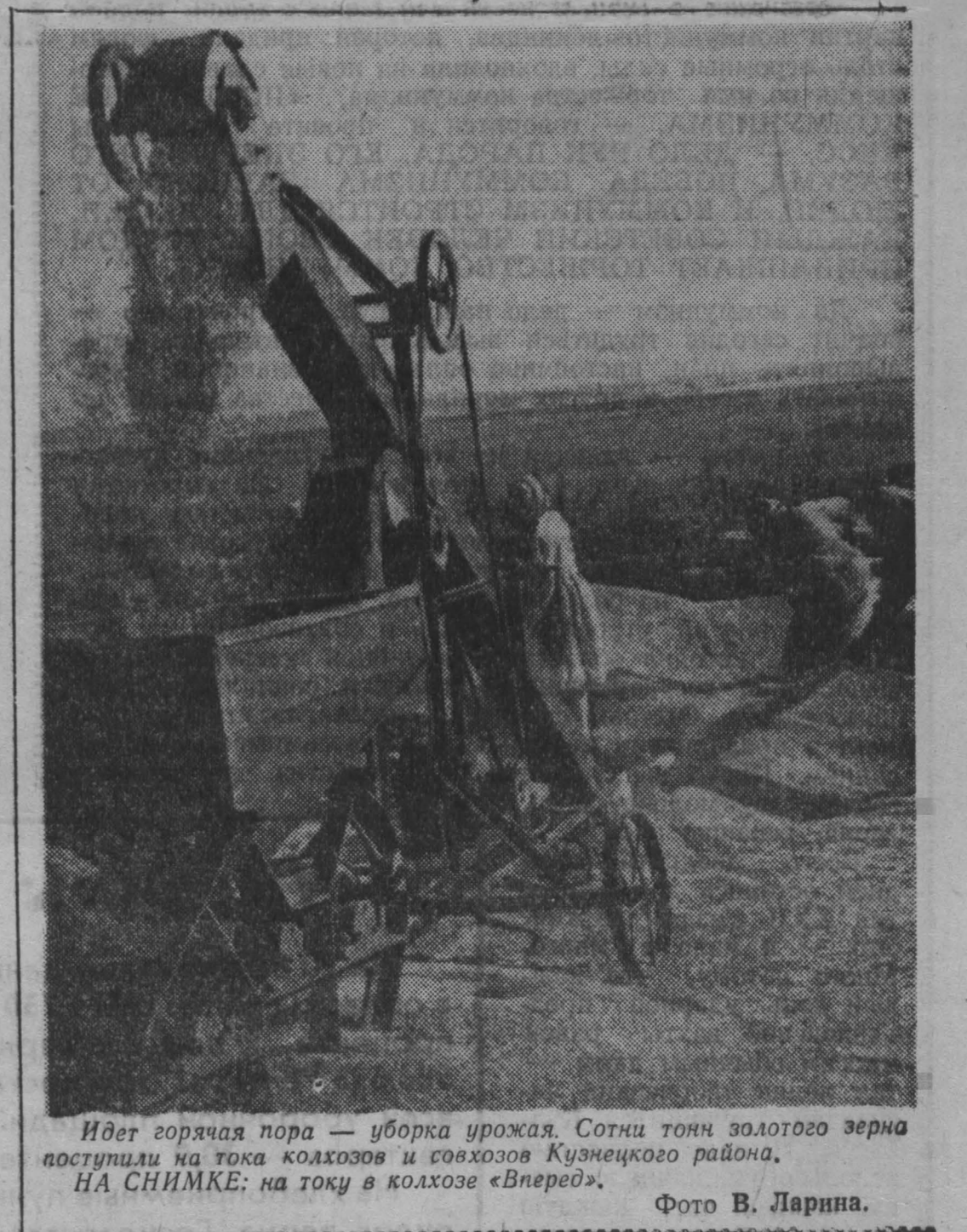
Идет горячая пора — уборка урожая. Сотни тонн золотого зерна поступили на тока колхозов и совхозов Кузнецкого района. НА СНИМКЕ: на току в колхозе «Вперед».

Руководитель бригады коммунистического труда участка № 5 шахты «Полюсвасильская-1», г. Ленинск-Кузнецкий.