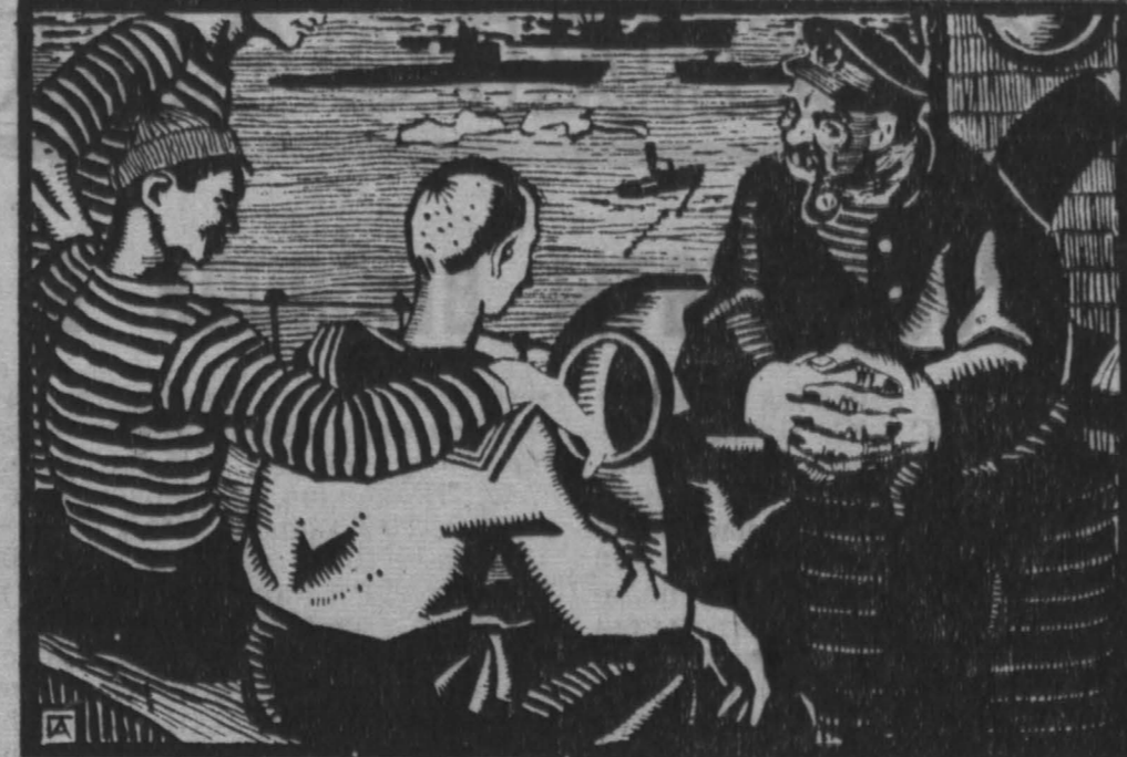
Рис. А. Гетманского.