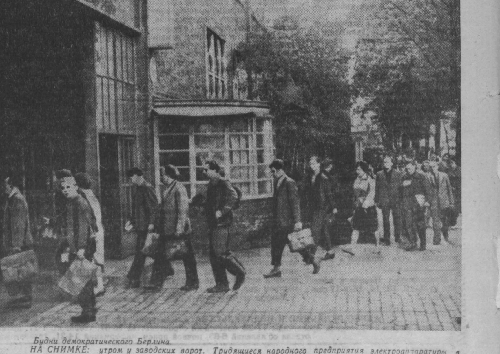
Будни демократического Берлина. НА СНИМКЕ: утроем у заводских ворот. Трудящиеся народного предприятия электротаратари района Трентов идут на работу.

закупают давным-давно не проданные топоры, потерченные пилы. А за известную сумму вынуждены ездить на рынки в Юргу или Болотное и покупать там ее у спекулянтов. Руководители Юргинского райпотребсоюза бываю в магазинах райкоопов и сельпо, но мнутся с нарушениями правил торговли, с уязвостью ассортимента хозяйственных товаров на прилавках. Не видно, чтобы они проявляли инициативу и заказывали местным промышленным предприятиям самые необходимые товары, которые могли бы лучше удовлетворять спрос населения.