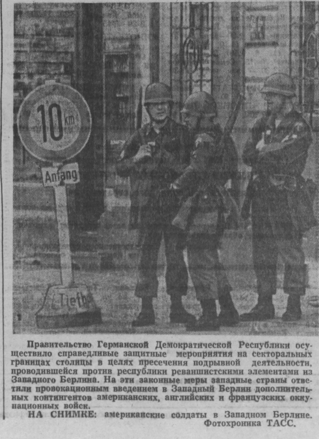
НА СНИМКЕ: американские солдаты в Западном Берлине.

НЬЮ-ЙОРК, 11 сентября. (ТАСС). Ураган со скоростью ветра в 173 мили в час движется по Мексиканскому заливу к южному побережью Соединенных Штатов. Свыше 500 тысяч человек, живущих в низинах между Камероном (штат Луизиана) и Корпус-Кристи (штат Техас), бежало в густые страны, чтобы избежать надвигающегося шторма. Некоторые города почти полностью покинуты жителями, сообщает агентство Ассошиэйтед Пресс. «Водные валы высотой до 11 футов обрушились на покинутые города», — говорится в сообщении агентства. Город Галвестон (штат Техас) отрезан; последние его шоссе затоплено водой. Только 15 тысяч жителей из 75-тысячного населения города остались там; остальные покинули город.