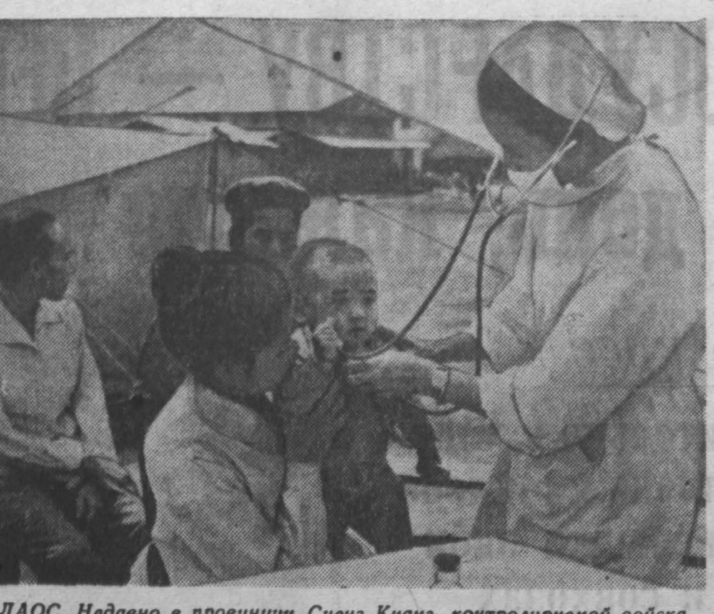
ЛАОС. Недавно в провинции Сиенг Куанг, контролируемой войсками законного правительства, открылась больница, рассчитанная на 160 человек. Медицинская помощь оказывается населению бесплатно.

Затем на митинге речь выступил Антуан Гизенга. Показав в примерах, как во время своего господства в Конго бельгийские колонизаторы усильно превращали в жизнь излюбленный метод колонизаторов «раздел и властвуй», Гизенга заявил: «Наша жизнь, наша борьба, особенно за истинный мир, показали, насколько важным и необходимым является единство всех политических сил, выступающих за подлинную свободу и независимость республики».