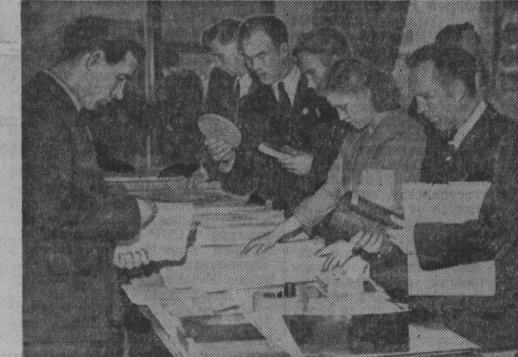
На семинаре была организована выставка новых строительных материалов и изделий из них. НА СНИМКЕ: участники семинара знакомятся с экспонатами выставки.

Сейчас комсомольские собрания часто посещают руководите-