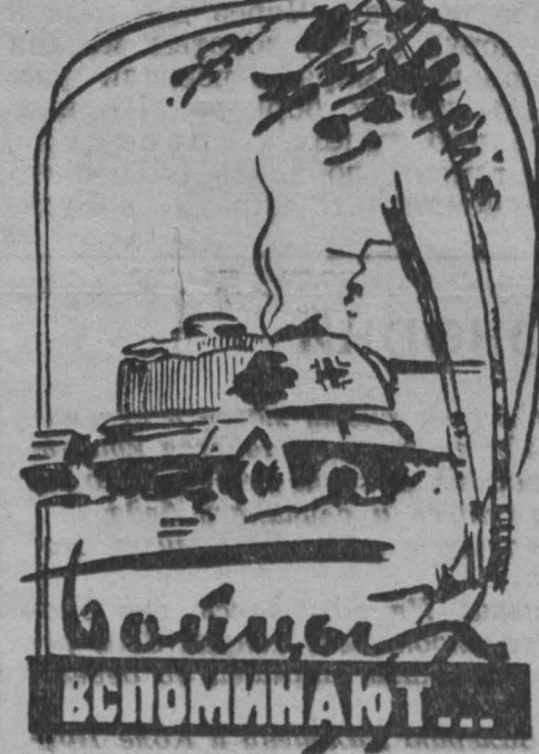
СНАЙПЕР ОТКРЫВАЕТ СЧЕТ