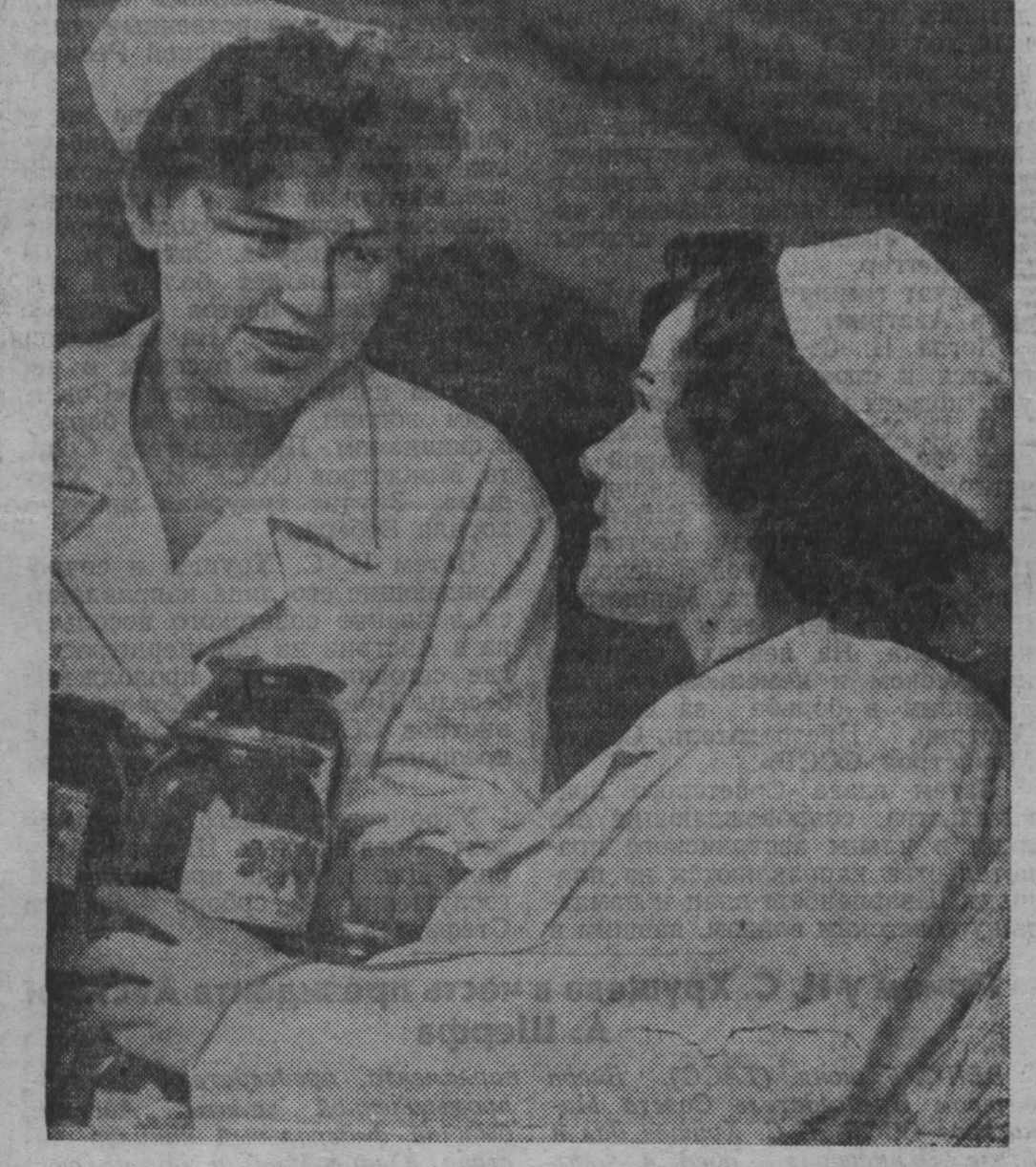
НА СНИМКЕ: лучшие работницы магазина «Гастроном» № 2 продовольственный магазин № 2 продовольственный магазин № 2 продовольственный магазин № 2

Почти по 18 килограммов озуроченного картофеля получают озурочивая картофельные клубни в теплице.