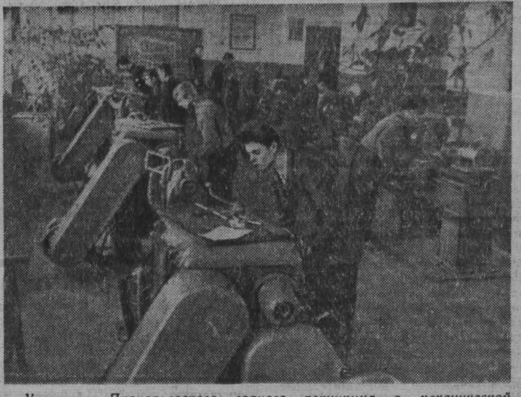
Учащиеся Прокопьевского горного техникума в механической мастерской.

Вечернее отделение: 1. Оборудование химических заводов; 2. Технология органического синтеза; 3. Технология неорганических веществ — на базе 7 кл.