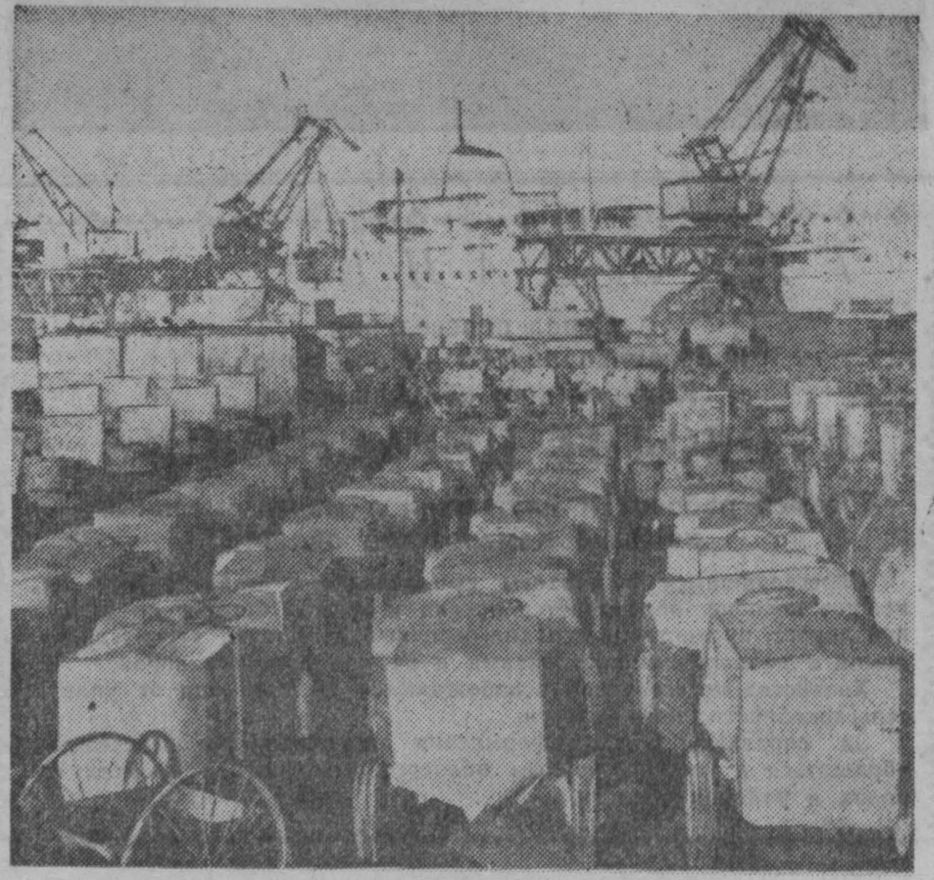
Польская Народная Республика. В Гдыньском порту. Тракторы «Урсус», предназначенные для отправки за границу.

ХАНОИ, 12 января. (ТАСС). С 28 декабря 1960 года по 6 января 1961 года проходил 3-й пленум ЦК Партии трудящихся Вьетнама. Пленум сообщает Вьетнамскому информационному агентству, посыле итоги выполнения трехлетнего государственного плана 1958—1960, наметил и обсудил задачи государственного плана на 1961 год. Пленум заслушал также отчет партийной делегации, участвовавшей в ноябре 1960 года в работе Совещания представителей коммунистических и рабочих партий в Москве. Пленум принял две резолюции: о государственном плане на 1961 год и о Совещании представителей коммунистических и рабочих партий. На пленуме было принято решение об изучении документов этого Совещания членами Партии трудящихся Вьетнама.