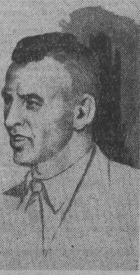
Что вы хотите сказать молодым спортсменам?

Петр Болотников — один из героев закончившегося олимпийского года. Специалисты до сих пор продолжают обсуждать его необычайные успехи, которые многим кажутся загадочными.