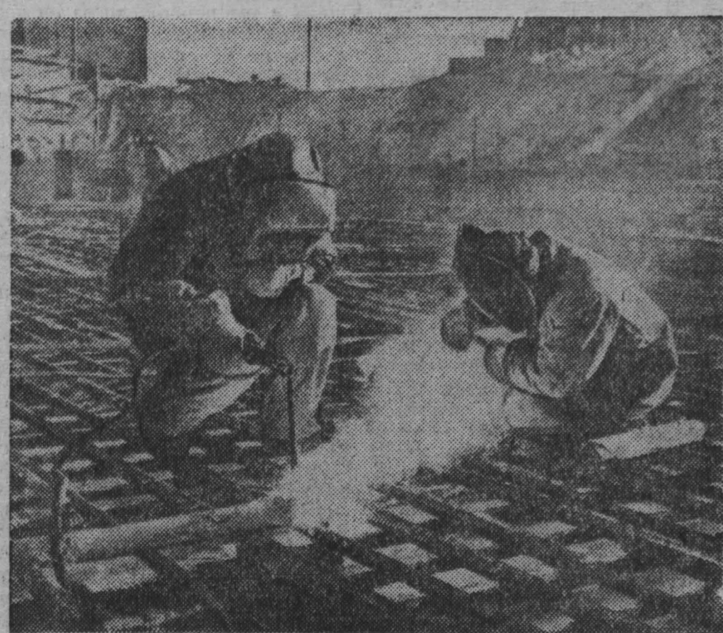
На Новолипецком металлургическом заводе началось сооружение новой домы. Стройка объявлена ударной комсомольской. Строители обязались завершить ее в 1961 году. Сейчас сооружаются фундамент и поддон домы. На снимке: на строительстве новой домы.