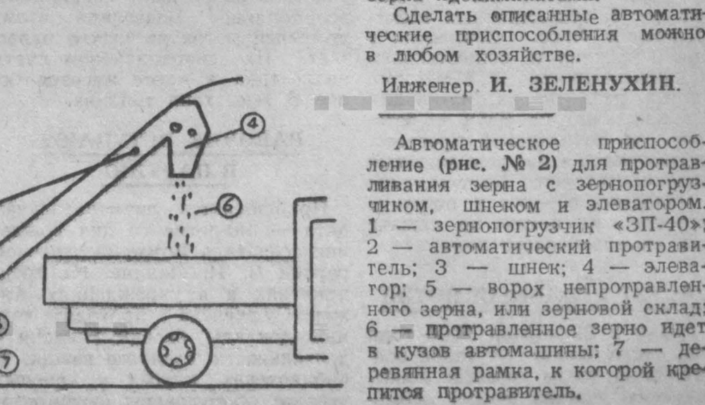
Инженер И. ЗЕЛЕНУХИН. Автоматическое приспособление (рис. № 2) для протравливания зерна с зернопогрузчиком, шнеком и элеватором.