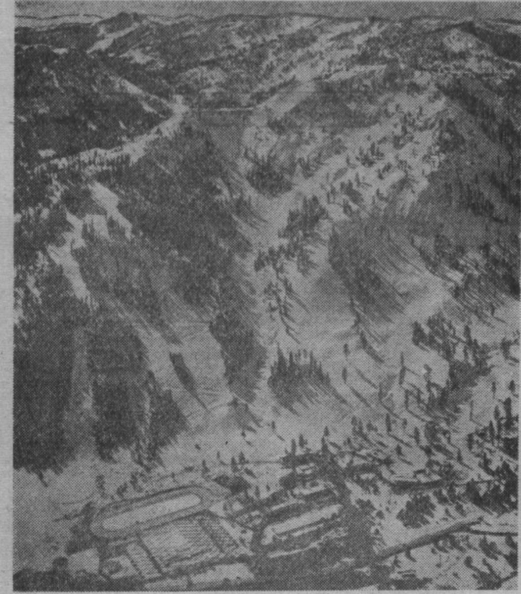
СОЕДИНЕННЫЕ ШТАТЫ АМЕРИКИ. Общий вид местности в связи с валью, где будут проходить зимние Олимпийские игры. На этой горе состоится соревнования по прыжкам с трамплина и слалому. У подножия горы — бетонная дорожка для конькобежцев, главная ледяная арена, административные и вспомогательные помещения.