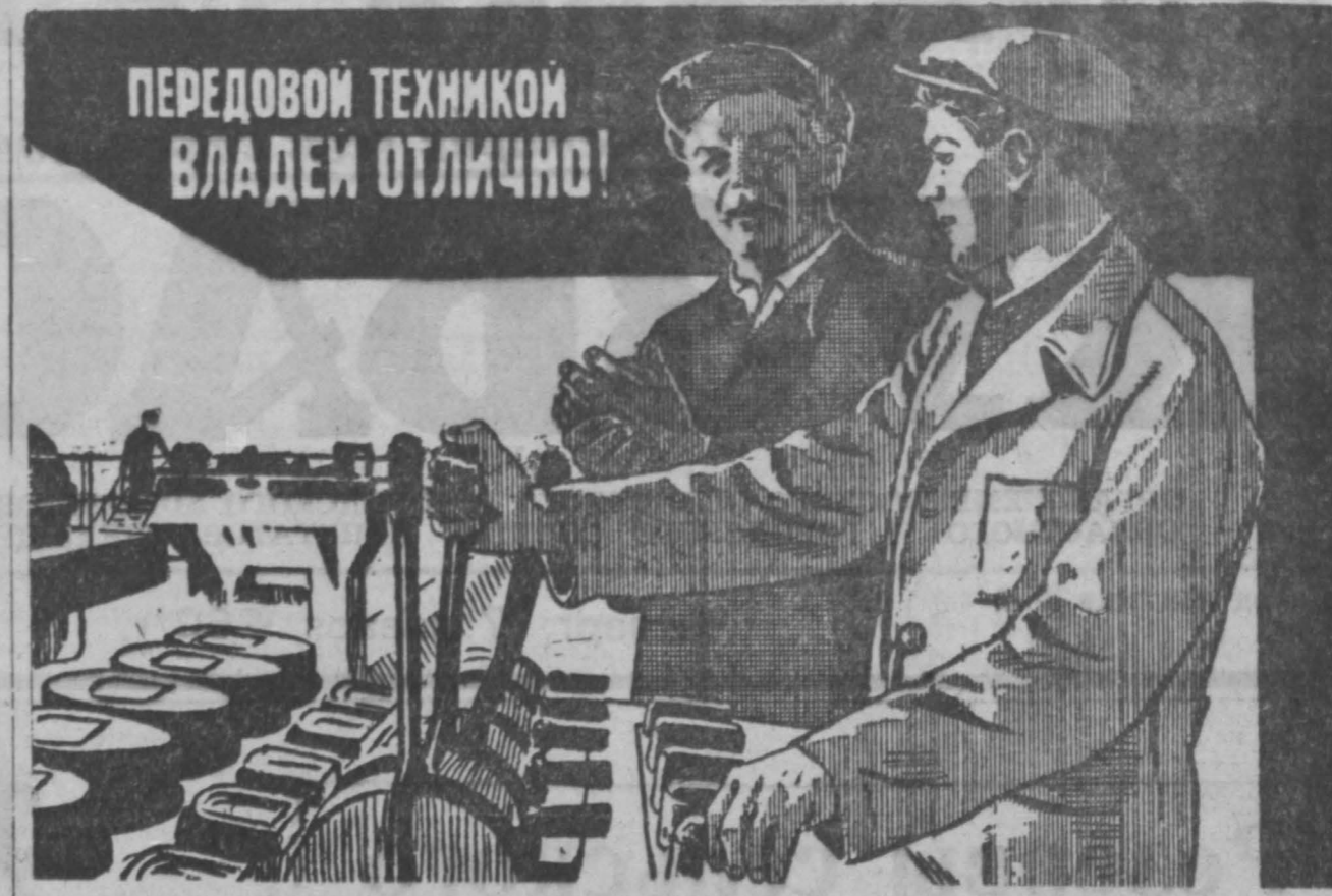
С плаката художника И. Гришштейна.

Претворяя в жизнь решения XXI съезда партии и июньского пленума ЦК КПСС, шахтеры Кузбасса успешно закончили первый год семилетки. Нарядное хозяйство страны получило от горняков Кузбасса более 450 тысяч тонн сверхпланового топлива. По сравнению с 1958 годом добыча угля в минувшем году увеличилась на 4,5 млн. тонн. Перевыполнено задание и по коксующимся углям.