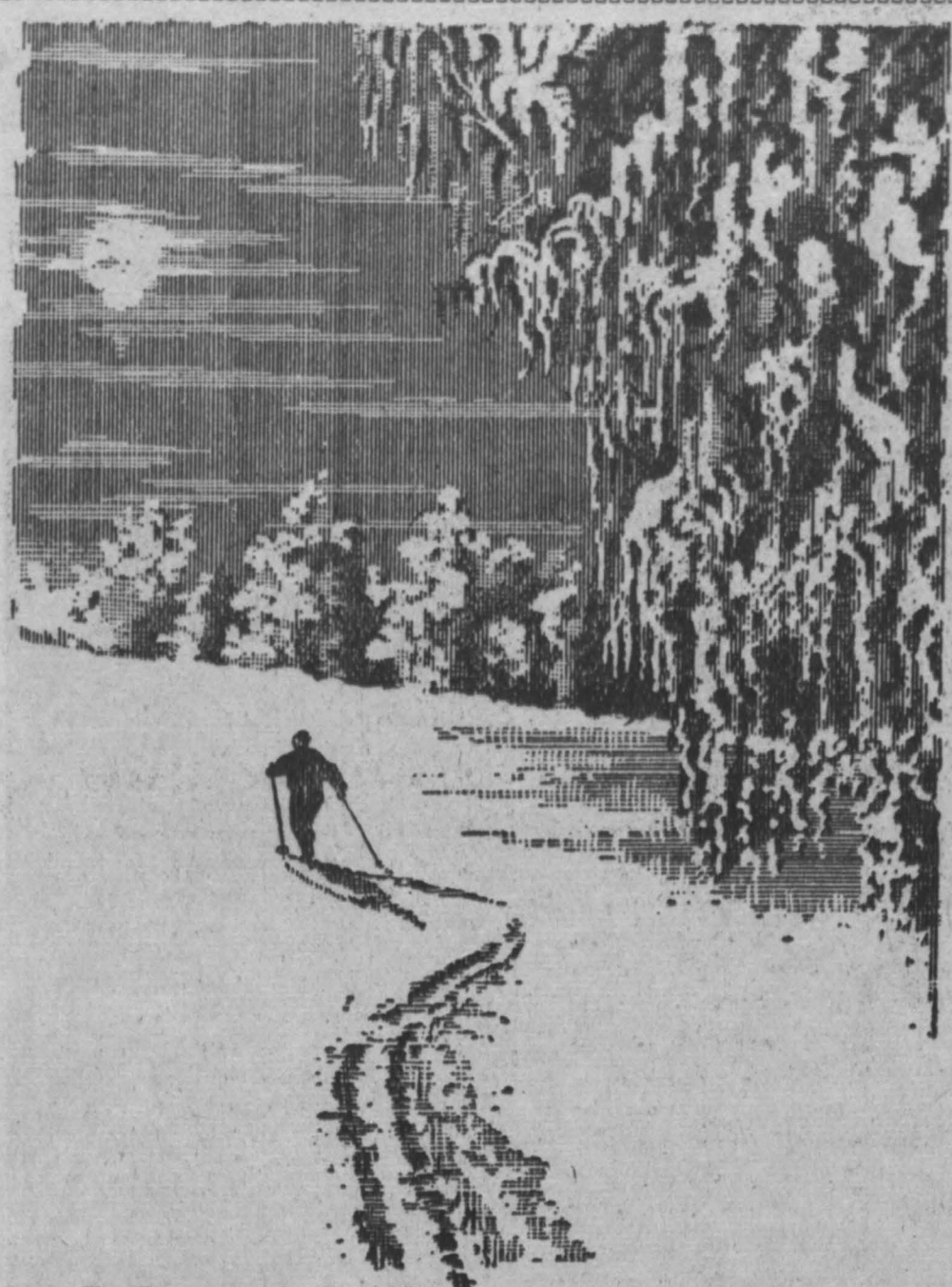
Рис. Е. Смирнова.