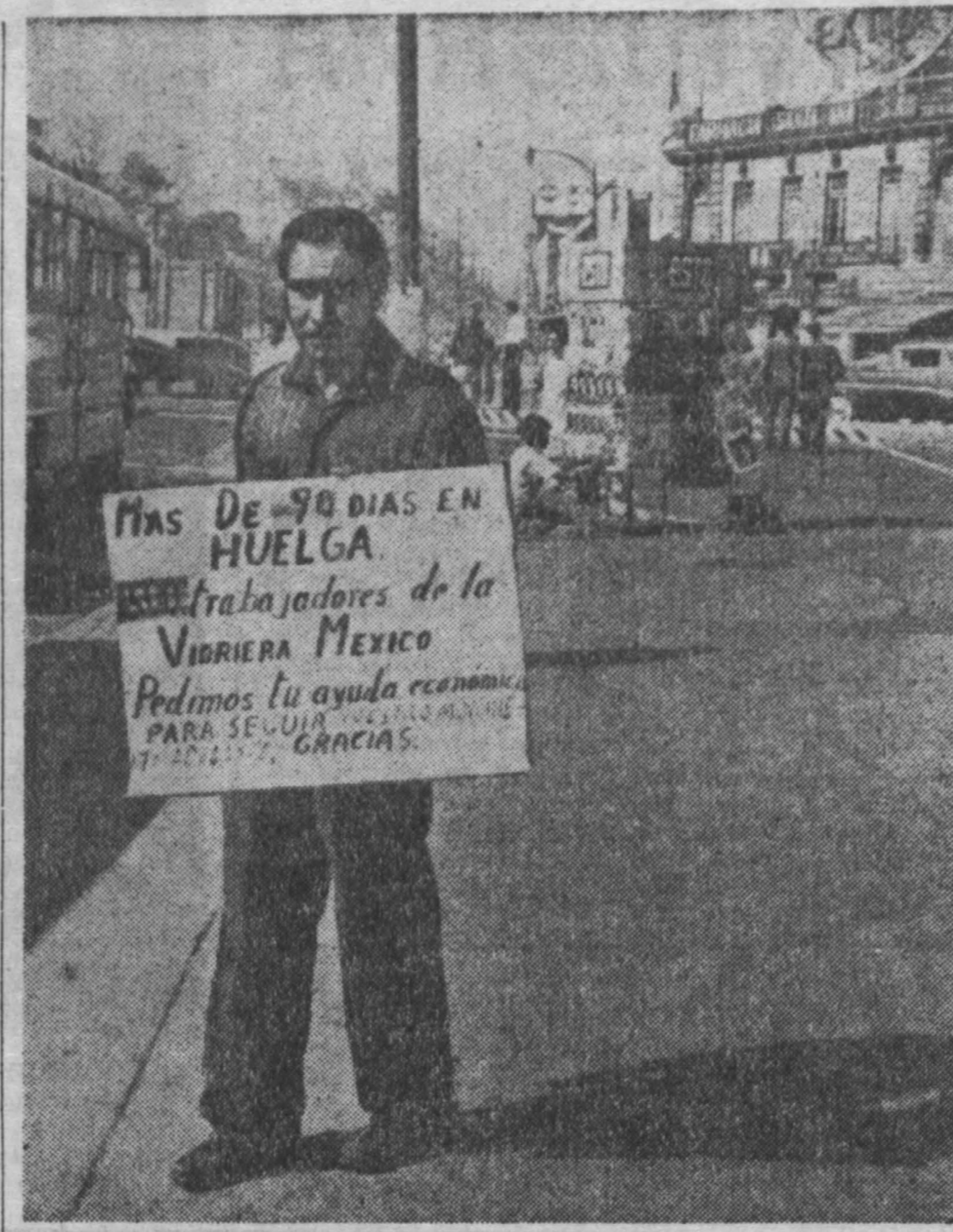
Мехико. Мехико. Рабочий стекольного завода «Видриера Мехико» собирает средства для своих товарищей, которые бастуют уже более трех месяцев, требуя повышения заработной платы.

Война, которую ведут французские империалисты в Алжире против вставшего народа, заявил делегат Белоруссии Максим Танк, — война прелюдия и несправедлива.