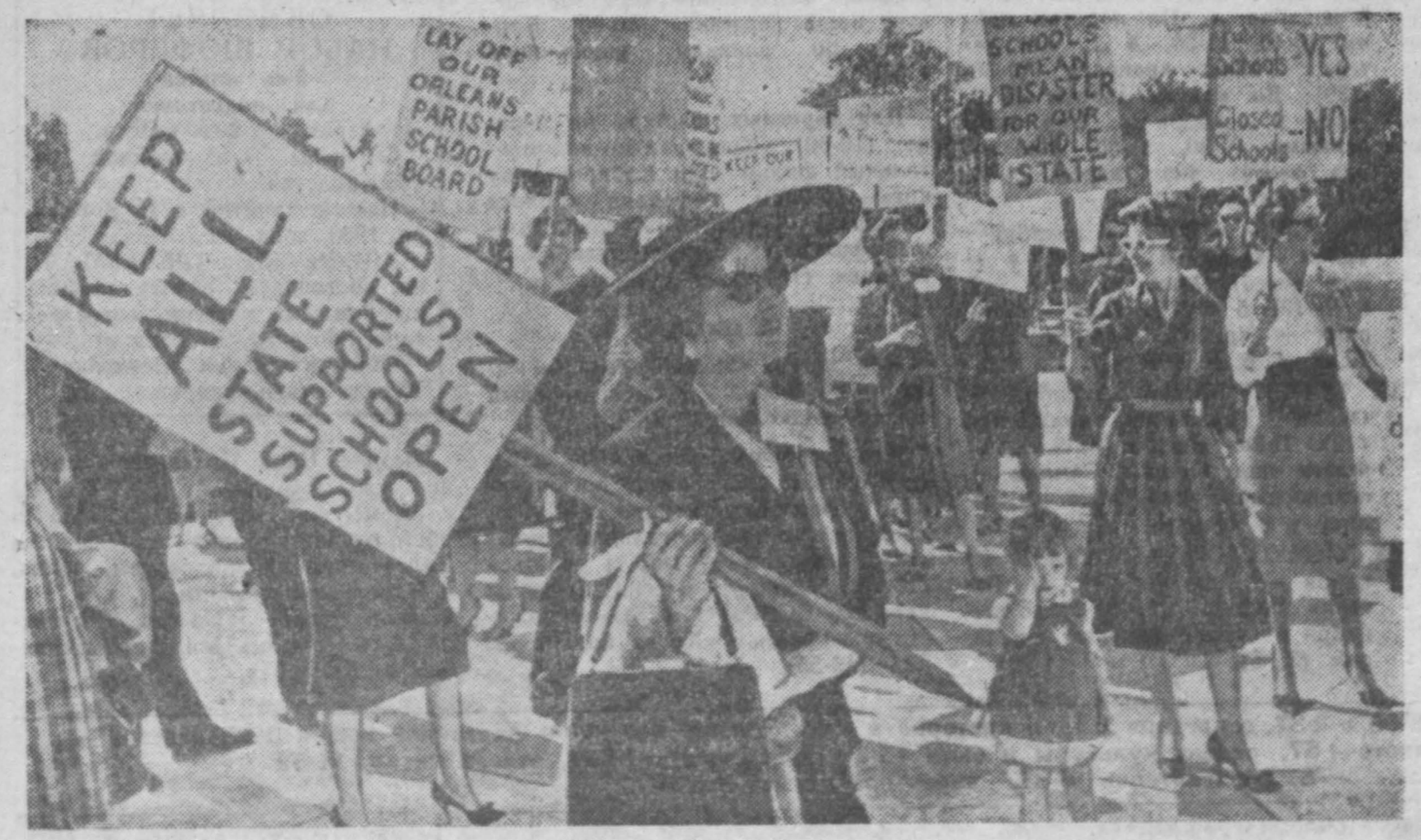
НА СНИМКЕ: во время демонстрации.

● Около города Эна (Япония) разбился реактивный истребитель воздушных сил национальной самообороны. (ТАСС).