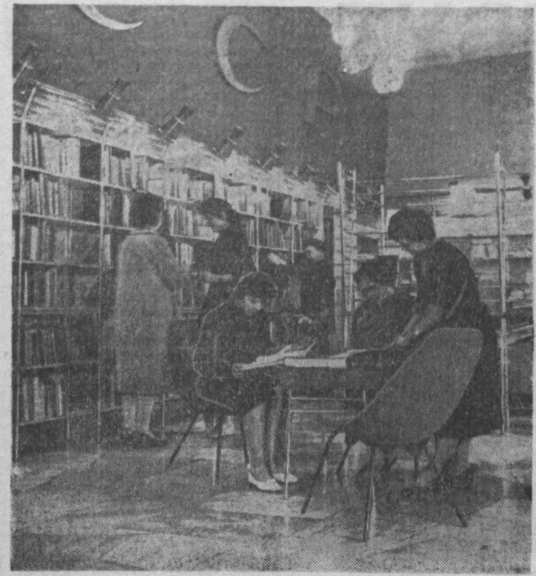
Чехословацкая Социалистическая Республика. В Оломоуце имеется магазин «Советская книга» — крупнейший в стране. В нем отделы технической и научной литературы, художественной, детской, отдел нот и грампластинок. По желанию покупателей нужные книги, которых нет в магазине, высылаются непосредственно из Москвы. НА СНИМКЕ: в магазине «Советская книга».

ДК ШАХТЕРОВ. Человек в коротких штанишках (3, 5-30, 8, 10). ДК ХИМКОМБИНАТА. Звезда на крыльях (3). Война и мир 2-я серия (5). Подводные рыбки (7 — дети до 16 лет не допускаются). КЛУБ ПОСЕЛКА ЮЖНОГО. Ваали от Родины (5, 7, 9).