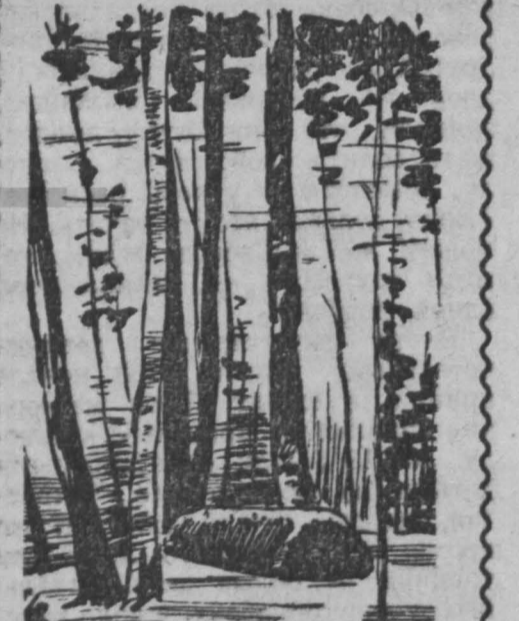
Могила Л. Н. Толстого в Ясной Поляне. Рисунок с фотографии 1940 года.