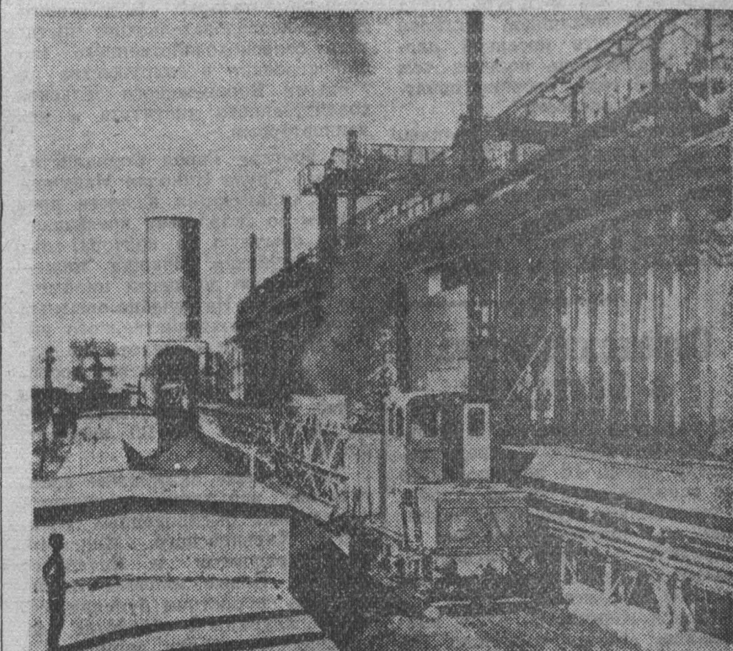
РЕСПУБЛИКА ИНДИЯ. Бхлайский металлургический завод, созданный совместным трудом индийских и советских строителей. — одно из крупнейших металлургических предприятий Азии.

После краткого замечания делегата Бирмы, заявившего, что он будет голосовать за предложение Кубы, кубинская делегация к докладу Генерального комитета, предлагающего передать жалобу революционного правительства Кубы на агрессивные намерения США на рассмотрение пленарного заседания Генеральной Ассамблеи, была поставлена на голосование. Ее поддержали 29 делегаций (Афганистан, Албания, Болгария, Бирма, Белорусской ССР, Камбоджа, Цейлон, Кубы, Чехословакия, Эфиопия, Ганы, Гвинея, Венгрия, Индия, Индонезия, Ирак, Ливия, Мали, Марокко, Непал, Нигерия, Польша, Румыния, Саудовской Аравии, Украинской ССР, СССР, ОАР, Йемена и Югославия), 18 делегаций воздержались (Боливия, Камерун, Республика Центральная Африка, Республика Чад, Конго (Браззавиль), Доминиканская республика Эквадора, Израиль, Иордания, Ливан, Либерия, Мексика, Панама, Сенегал, Судан, Того, Туниса и Вьетнама). Делегации 45 стран, главным образом союзников США по военным блокам и других западных держав, проголосовали против. 5 делегаций отсутствовали. Таким образом, если Соединенным Штатам и на этот раз с помощью послушного механизма большинства голосовать удастся добиться угодных результатов, голосование в целом показывает, что подлинно независимые малые страны не пошли за ними и даже некое латиноамериканские государства заняли недвусмысленную позицию. Таким образом, вопрос о жалобе правительства Кубы на подготовку США агрессии против этой страны будет передан на рассмотрение Политического комитета.