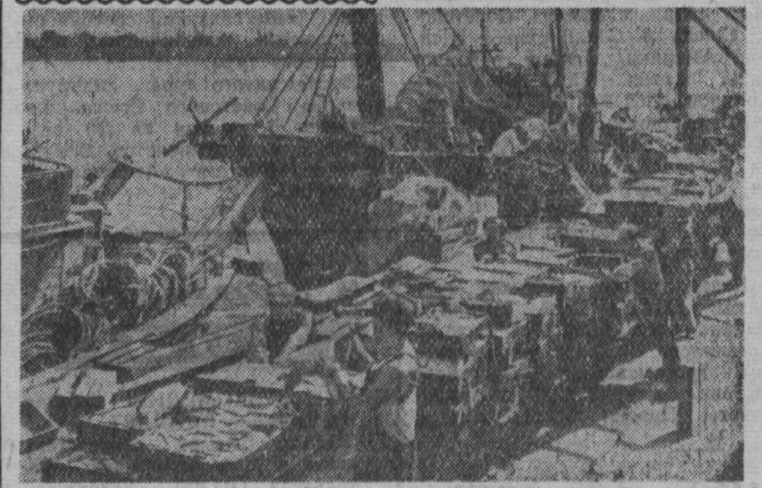
500 тысяч рыбок Китая развернули соревнование за досрочное выполнение плана добычи рыбы и других продуктов водного промысла. В разгар осенней путны. Большую помощь рыбакам оказывают государство. В настоящее время рыбоплавательный флот в Китае насчитывает более 80 тысяч судов и джонок.

Этот способ мне пришлось внедрять на одном из лесозаготовочных трестов «Кузнецких». Трактористы, лесорубы — в восторге от него. Опытные трактористы быстро усвоили все «тонкости» нового способа и затрачивали не более 15 минут на погрузку автомашин. Со временем, безусловно, они достигнут большего. Но беда в том, что некоторым этот способ погрузки показался «не инженерным» и слишком простым. Кто-то стал притворно высказывать мотивы, порочащие его: возможность только трактора, отсутствие у нас «сухих»(?) мест и т. д. Призываем, за первое вознаграждение мы опасаемся, но в печати выступили со статьей главный инженер и главный конструктор Алтайского тракторного завода и рассказали наши сомнения. Что