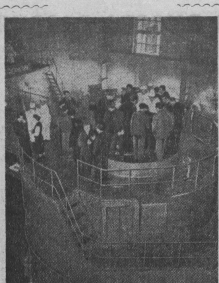
Ленинград. В Физико-техническом институте Академии наук СССР пущен атомный реактор мощностью в 10.000 киловатт. На снимке: ученые Ленинграда осматривают атомный реактор.