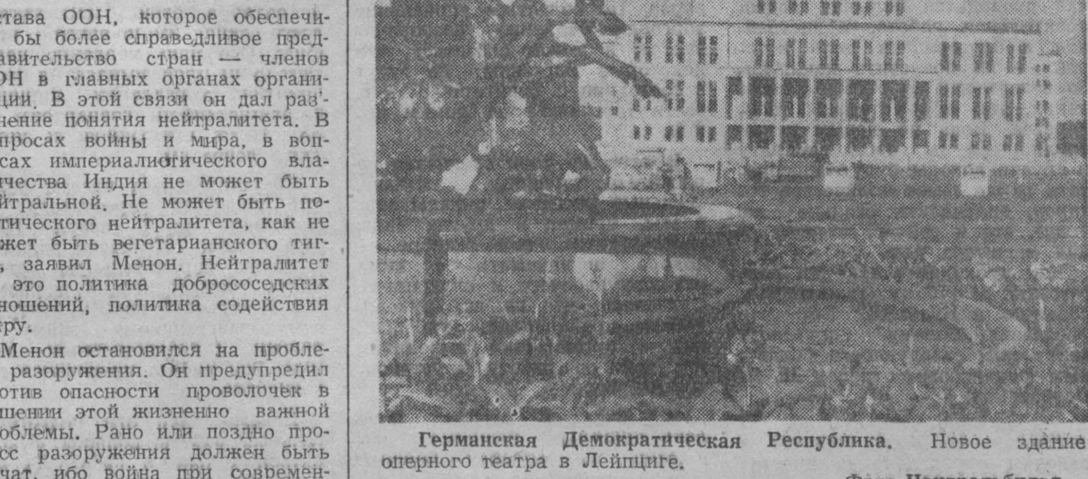
Геманская Демократическая Республика. Новое здание оперного театра в Лейпциге.