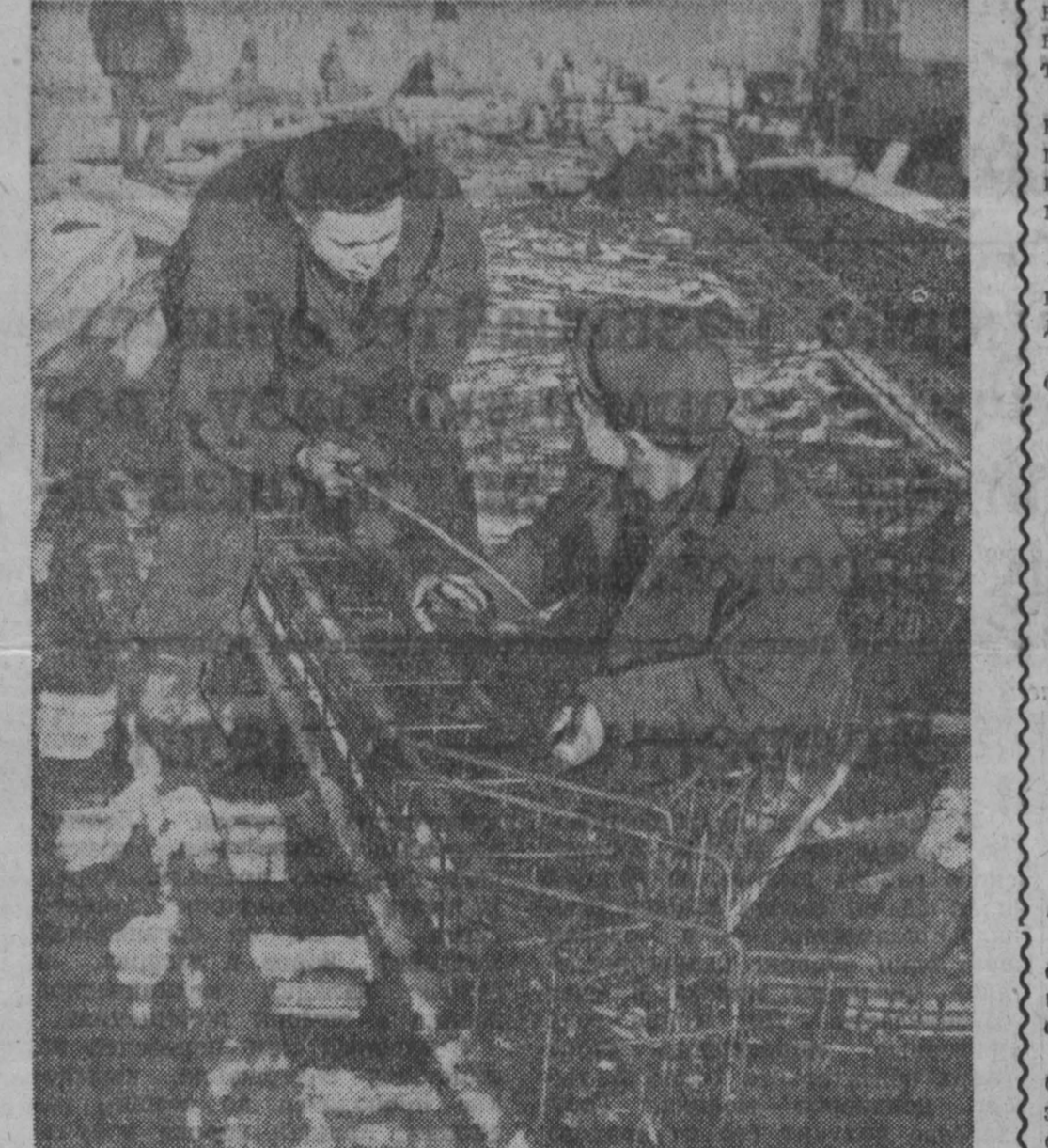
НА ЗАВОДЕ железобетонных конструкций № 3 треста «Строиндустрия» успешно освоили изготовление ферм АФН-97-2. Они используются на строительстве новых корпусов алюминиевого завода.