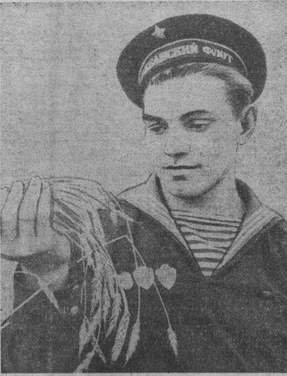
Вот она, родная...

Мы, сотрудники редакции районной газеты «Колхозник Кузбасса», возвращались 27 сентября из очередной поездки по району. Узкая лента дороги пробегала между хлебными массивами колхоза им. Димитрова. Неожиданно из-за поворота дороги показался моряк с чемоданом в руке.