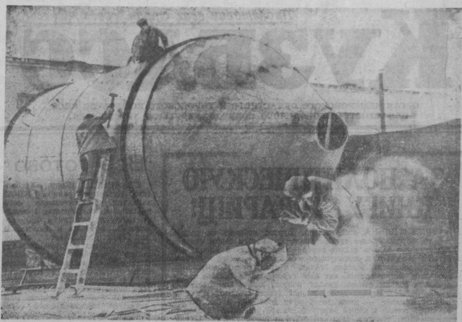
Новый завод котельно-исполнительного оборудования построен недавно в Калтане. 27 сентября коллектив завода приступил к выполнению большого заказа для строителей в Сибири новых мощных тепловых электростанций.

Есть такое слово и на всех языках народов нашей планеты. А. ВОЛОШИН, писатель, лауреат Сталинской премии.