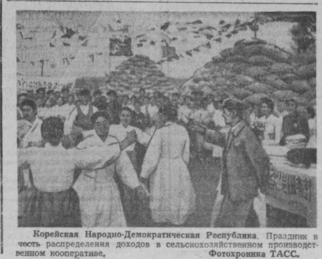
Корейская Народно-Демократическая Республика. Праздник в честь распределения доходов в сельскохозяйственном производственном кооперативе.

Б. ТРАПЕЗНИКОВ. НА СНИМКЕ: А. А. Филатов учит сборщика А. Чарушину и В. Г. Старикова установке на панели нового образца блока контактов.