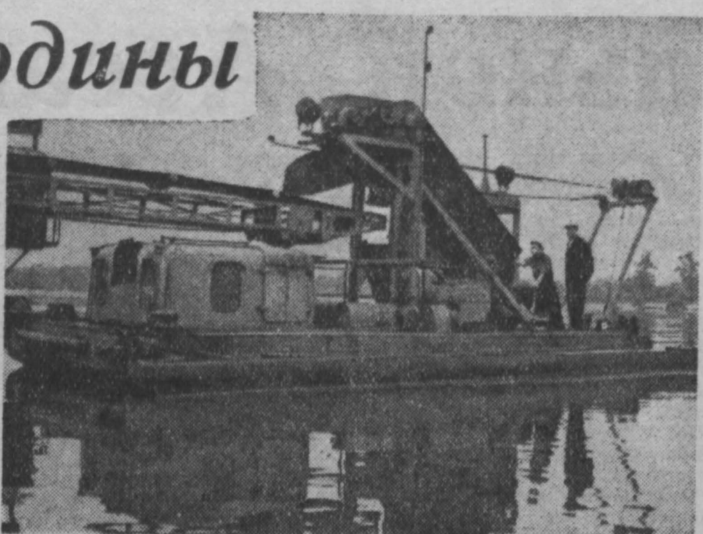
Ленинград. В Центральном научно-исследовательском институте леса и слыва создан опытный образец малогабаритной землеремальной, предназначенной для мелкоразмерных работ на малых реках. Производительность машины — 30 кубометров грунта в час. Благодаря малым габаритам она маневренна и сможет работать в узких и мелководных реках. На снимке: общий вид малогабаритной землеремальной.