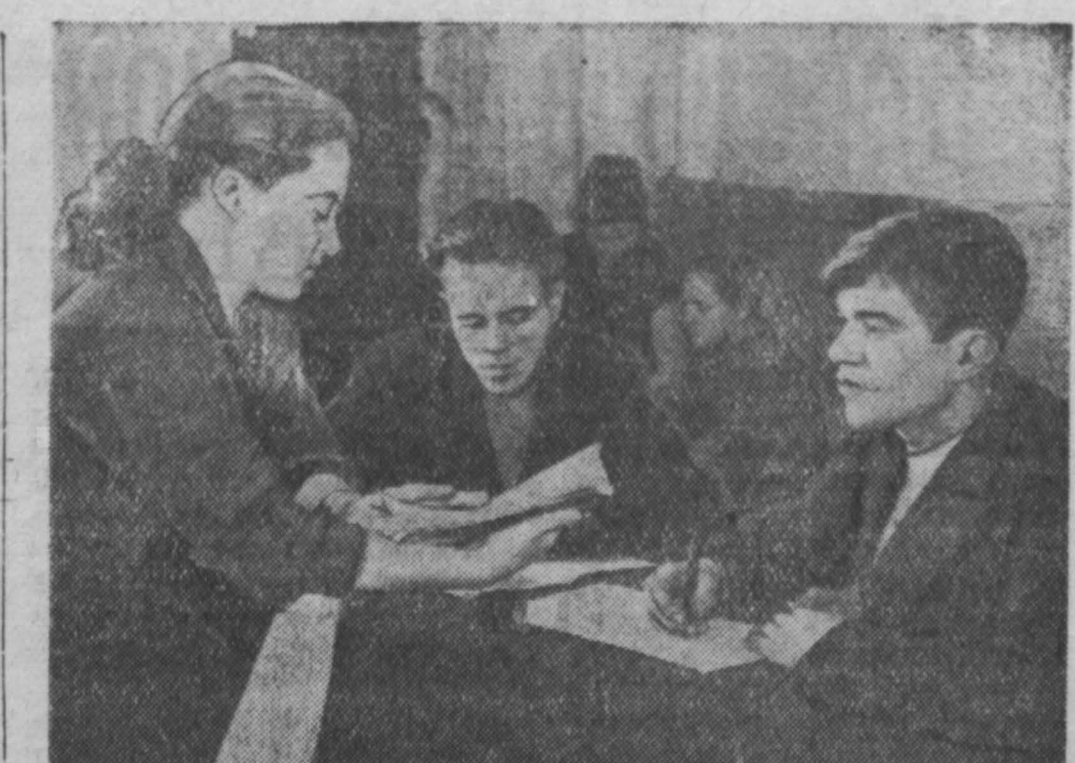
В этом учебном году Кемеровский пединститут взял шефство над школой рабочей молодежи № 6.

ОБЛДРАМАТЕАТР. Сегодня спектакль 28 января — Юпитер смеется. ТЕАТР МУЗКОМЕДИИ. В ДК химкомбината — Последний заряд. 28 января — Цыганская любовь. ГОСПИРМ. Сегодня четвертая программа сезона. Гастроли мастеров смека «Смерть весталки». Новое клоунадское представление «Вечер клоунады» и новая программа в трех отделениях. Весь вечер у ордена популярный комик-пародист — участник VI Всемирного фестиваля в г. Москве Петр Кукушкин. Начало в 8 часов вечера. КИНОТЕАТР «МОСКВА». 1. Новости дня № 52. Самоуверенный карандаш (9, 20—30 для детей). Человек в коротких штанишках (10-30, 12-30, 4, 6-20, 10-20). Широкоформатный фильм В елином строю (8-20). 2. Новости дня № 50. Укротительница тигров (9-30, 1-50 — для детей; 11-40, 4, 6-20, 10-20, 10-20). 3. Опасные шаги. Господи 420 — 1-я серия (9, 10-45, 12-30, 2-15, 4, 8, 10). Документальный фильм Чудесница (6-20). КИНОТЕАТР «М Е Т А Л Л У Р Г». Мальчики (10, 2 — для детей). История одного истребителя