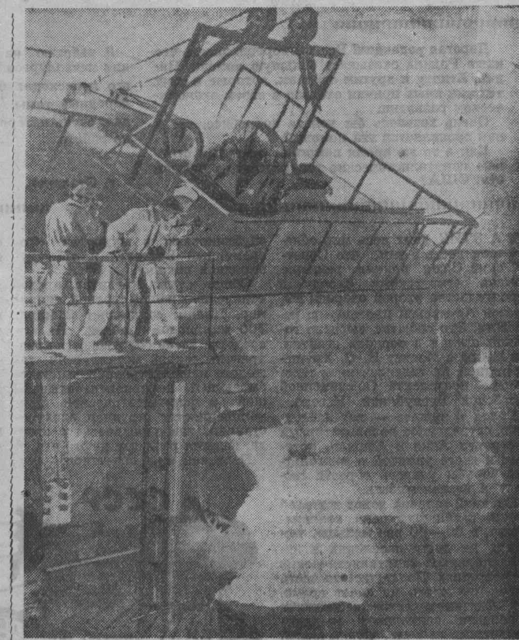
Корейская Народно-Демократическая Республика. Слив чугуна на миксера на металлургическом заводе имени Ким Ченг (провинция Северный Хамген).

объявил, что в связи с введением в Алжире осадного положения ответственность за поддержание порядка переходит от гражданских властей к военному командованию. Морис сообщил, что в город Алжир срочно направляются военные подразделения. В ночь на 25 января по радио было передано обращение президента республики де Голля, в котором он указывает, что «мятеж, поднятый в Алжире, — это злой удар для Франции». Президент де Голль призвал «тех, кто встал в Алжире против родины, будущи события с толку лояльно и кивельной, вернуться к порядку». В Париж срочно вернулся из Бретани премьер-министр Мишель Дебре (выехавший туда вчера днем); в течение ночи проводились правительственные совещания с участием президента республики де Голля и высших военных властей. Сегодня рано утром по приказу prefecta полиции в Париже запрещены все собрания, митинги и демонстра-