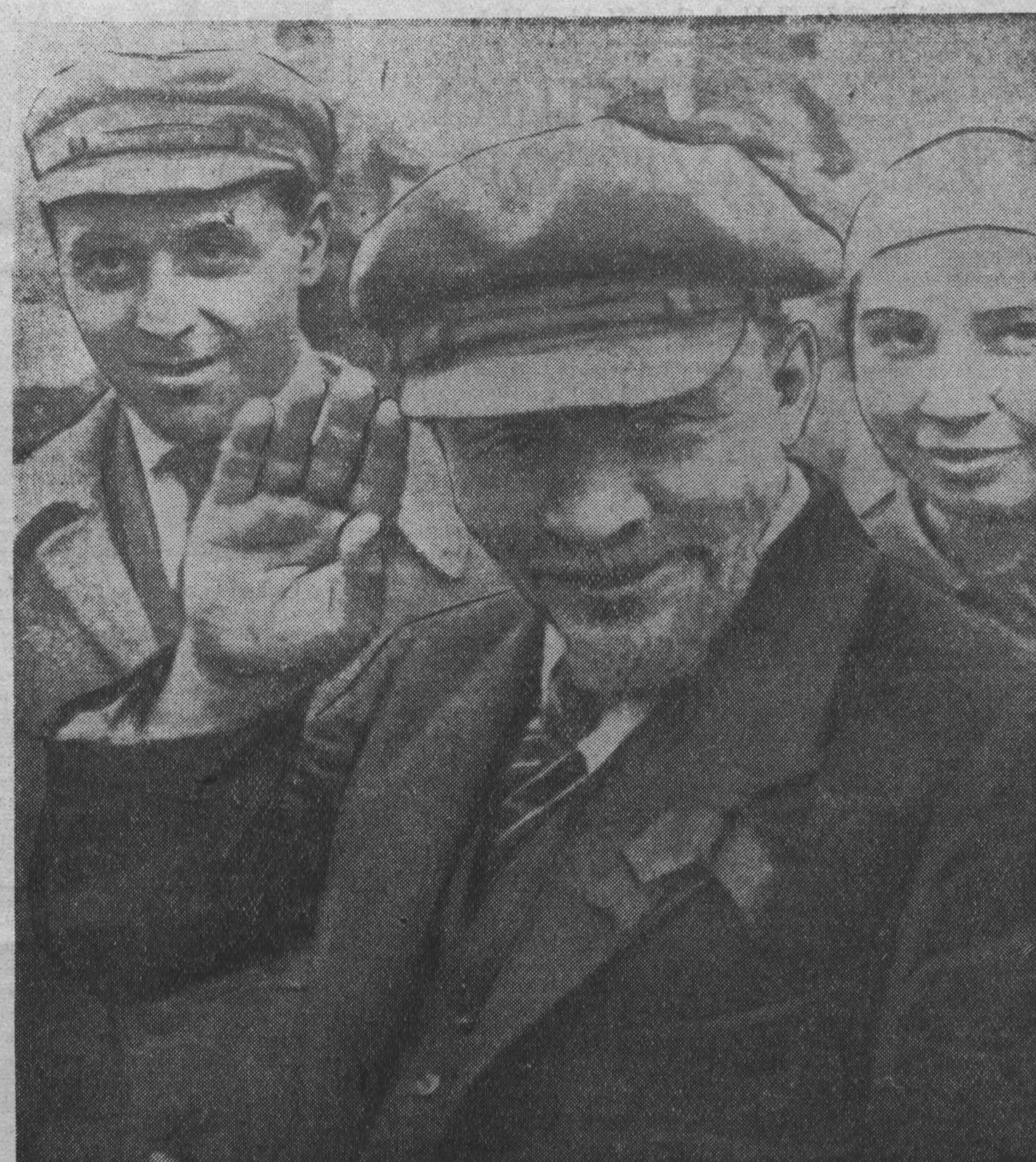
В. И. Ленин на закладке памятника «Освобожденный труд». Москва, 1 мая 1920 года (кинокадр).

(Из альбома, подготовляемого к выпуску Институтом марксизма-ленинизма при ЦК КПСС).