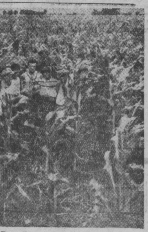
В Румынской Народной Республике в этом году большой урожай кукурузы. В колоритных сельских хозяйствах и госхозах внедряются передовые агротехнические методы. На полях можно увидеть растения, превышающие рост человека. На снимке: кукурузное поле в госхозе Улянь Пленештской области. Фотохроника ТАСС.

НЬЮ-ЙОРК. 22 сентября. (ТАСС). Как передает корреспондент агентства Ассошиэтед Пресс из Вьентьяна, сегодня премьер-министр Лаоса принц Суванна Фума объявил о первой крупной победе правительственных войск над мятежниками Фуми Носавана. Он сообщил, что правительственные войска под командованием капитана Коунг Ле захватили сегодня утром базу мятежников и город Паксан, расположенный в 100 милях восточнее столицы Лаоса. Войска мятежного генерала Фуми Носавана, преследуемые по пятам, отступают на юг. В боях за Паксан, продолжавшихся почти двое суток, было убито более 30 солдат Носавана. Войска Фуми Носавана пытались совершить из Паксана нападение на Вьентьян.