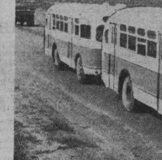
На снимке: пассажирский автобус.