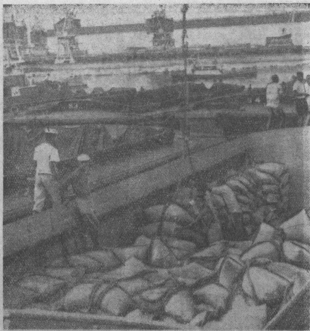
Гана занимает первое место в мире по сбору какао-бобов. НА СНИМКЕ: в порту Такоради. Рабочие укладывают мешки с какао-бобами в баржу.

Подобное отношение к животноводству наблюдается в Гурьевском и в других районах. Вряд ли мест, видимо, забыли о том, что при любых условиях, в любую ответственную кампанию сельскохозяйственного года животноводство, особенно молочное, для нашей области и, стало быть, для каждого совхоза и колхоза является основной отраслью, главным направлением в развитии сельского хозяйства.