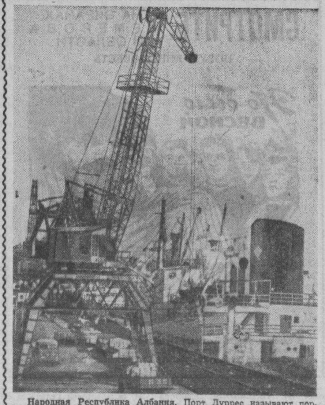
Народная Республика Албания. Порт Дуррес называется портом дружбы. Сюда ежедневно прибывает большое количество судов из различных стран.

Агентство отмечает, что 3 предыдущих запуска ракеты «Стронг Арм» также «не удалось из-за неполадок».