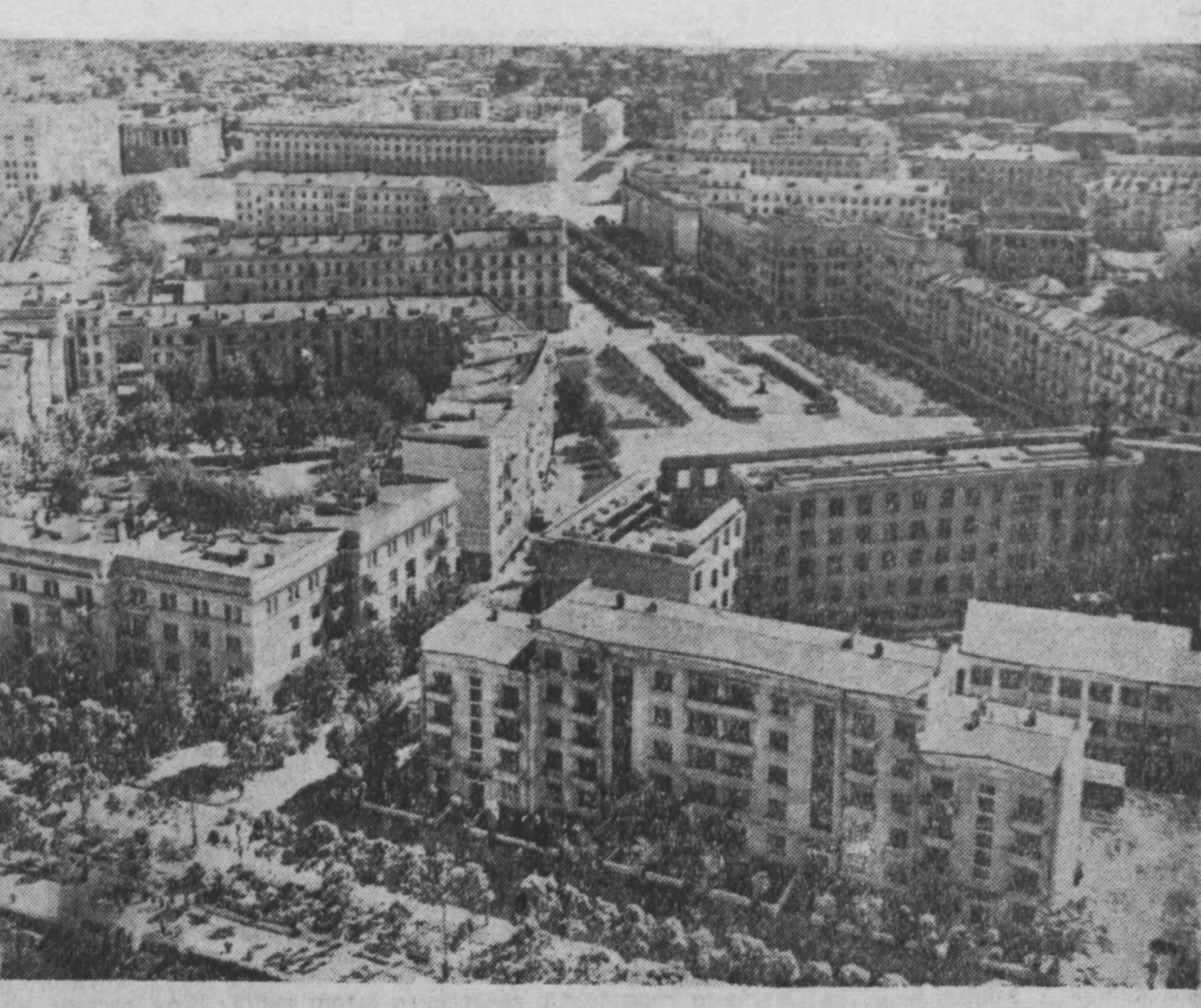
Кемерово. Вид Притомского участка с вертолета.

А затем наш коллектив выступил с концертом перед посетителями ВДНХ. Зрителям устроили бурную овацию исполнители. Дирекция ВДНХ наградила коллектив почетной грамотой. Успешно прошли выступле-