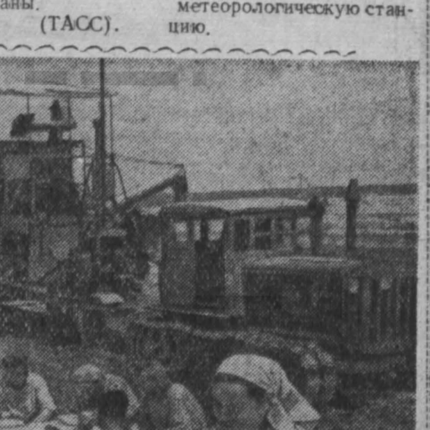
Таких машин, без которых невозможно было бы строительство в Коснице, в настоящее время в стране нет...