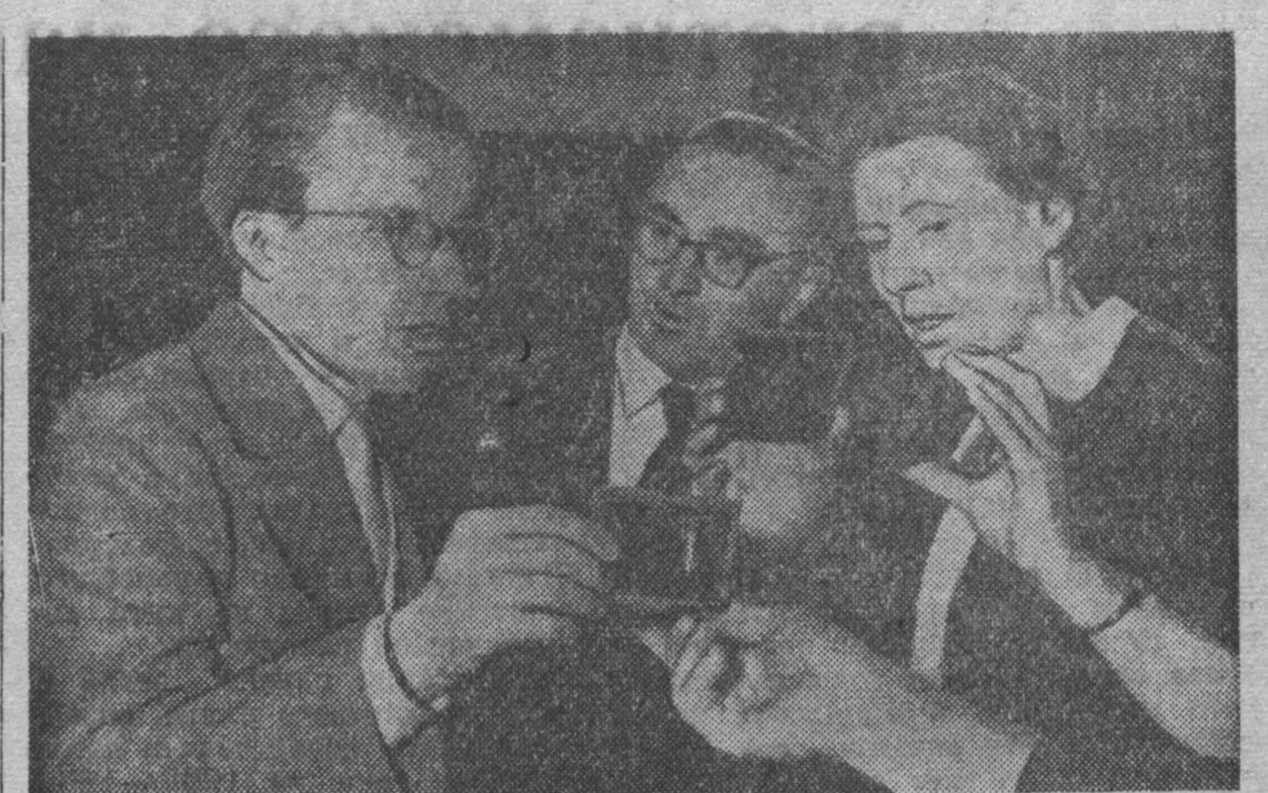
Венгерская Народная Республика. В Будпеште состоялась венгеро-советская медицинская конференция, обсуждавшая вопросы применения радиоактивных изотопов в лечебных целях.