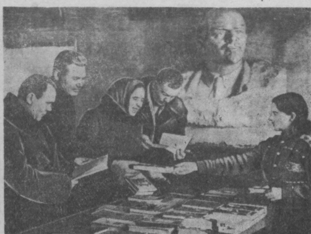
Книголюбители регулярно проводят продажу литературы по предприятиям и учреждениям города. Только за один день 15 января политическая, художественная, детская и техническая литература более чем на полторы тысячи рублей.

Здесь же в часовой мастерской производится ремонт часовых систем и марок. Срок выполнения работ 2—3 дня.