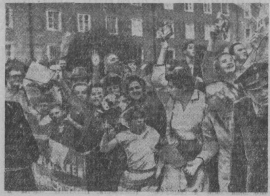
НА СНИМКЕ: жители австрийской столицы Вены приветствуют Н. С. Хрущева.

Н. С. Хрущев вручает тирольцам подарки. Делегация Восточного Тироля вручает ему цветы. Одна из них передает букет и алые гвоздики, связанные в букет, олицетворяющий