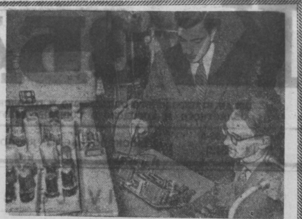
Москва. Прибор «РРУ» — радиоактивный регулятор уровня, действие которого основано на применении радиоактивных изотопов, показал хорошие результаты во время испытаний на нескольких предприятиях страны.